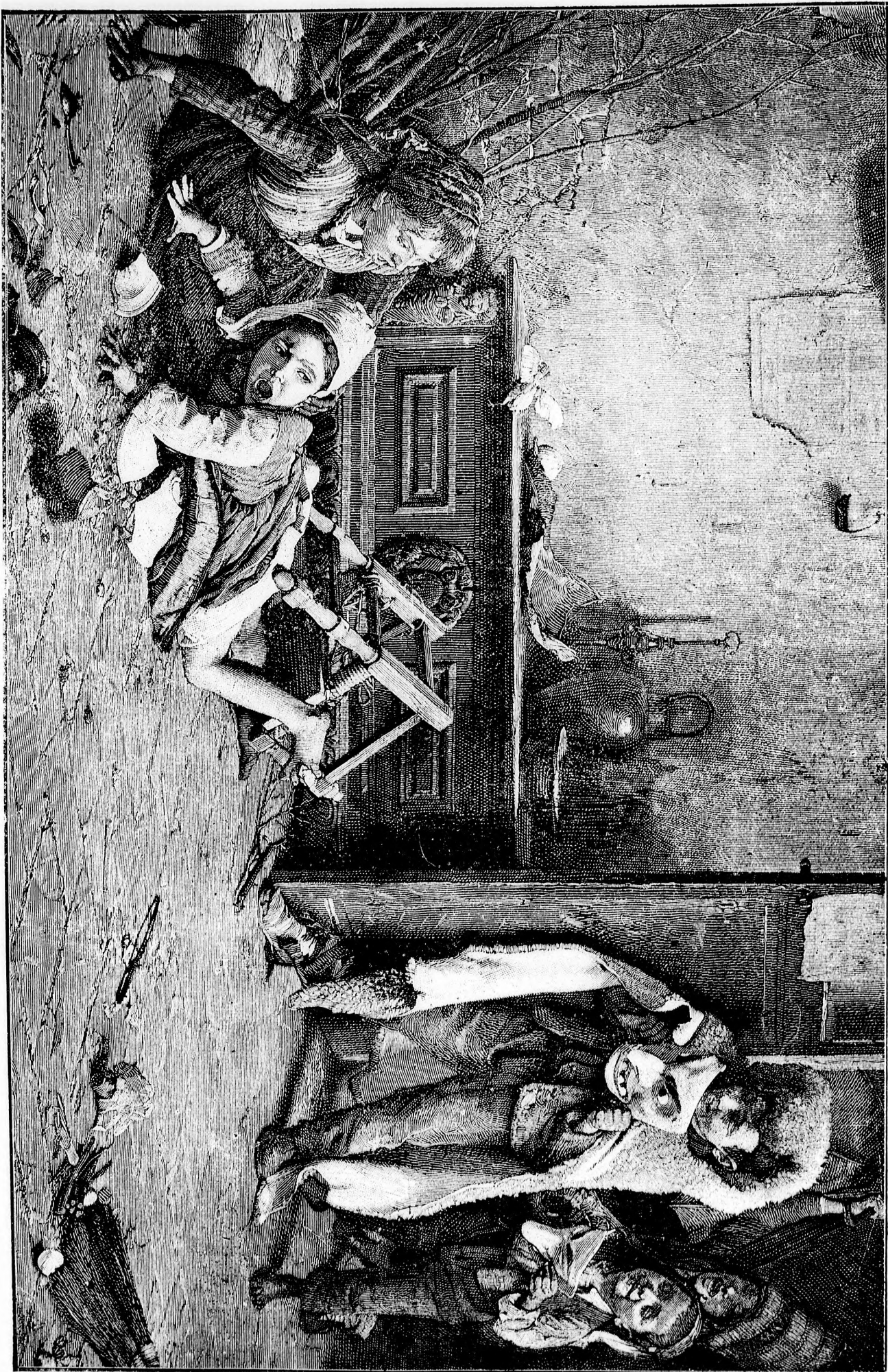
— FARSANG A GYEREKSZOBÁBAN. —