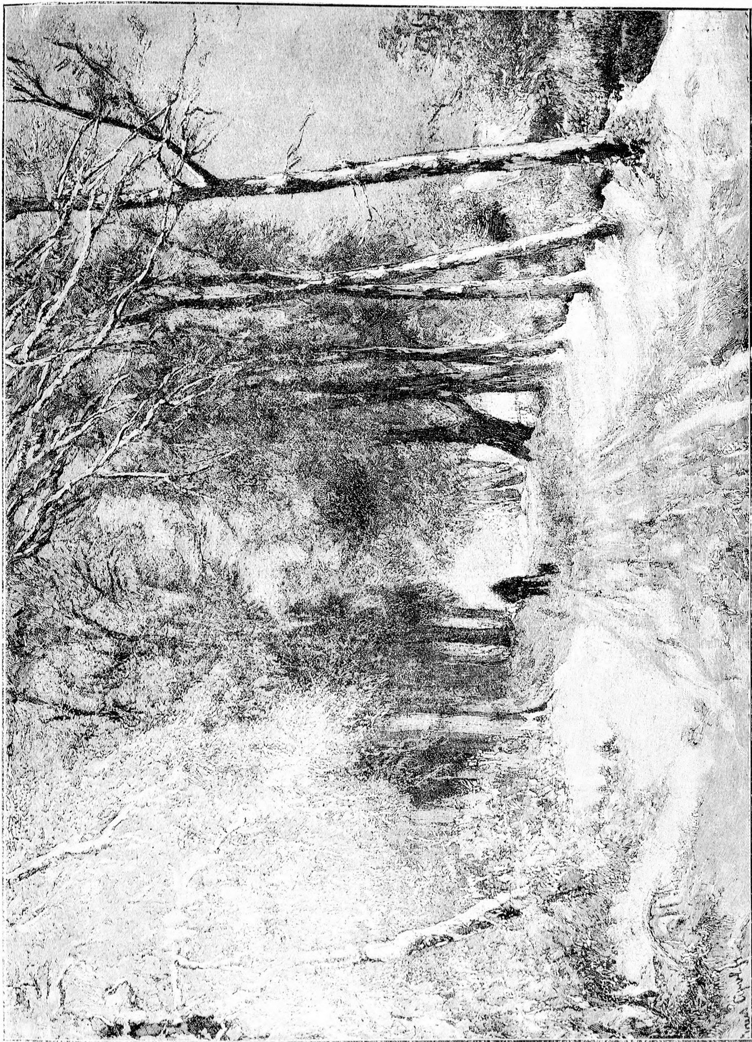
— szőlő TÉLEN AZ ERDŐ SZELEN. szőlő