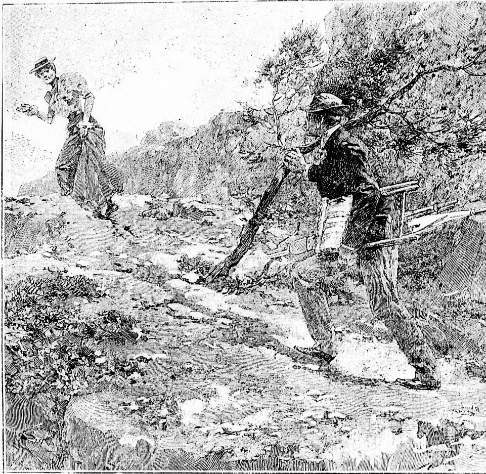
☞ A megszökött modell. ☜

E költemények olvasásakor a legritkább esetben találkozom Vörösmartyival, a 20—22 éves ifjuval. — Ez „A szép virág”, ez a „Tünnődő”, ez a „Sejtés”, ez a „Csaba szerelme”, „Szép leány”, „Földi menny” egyetlen hanggal sem igazolják, hogy itt élő ember jár, itt valaki igazán szeret, mélyen szenved, őszintén örül; hogy itt határozott törekvések forogának fenn. — Ezeket minden versiró elmondhatja, mint utczai