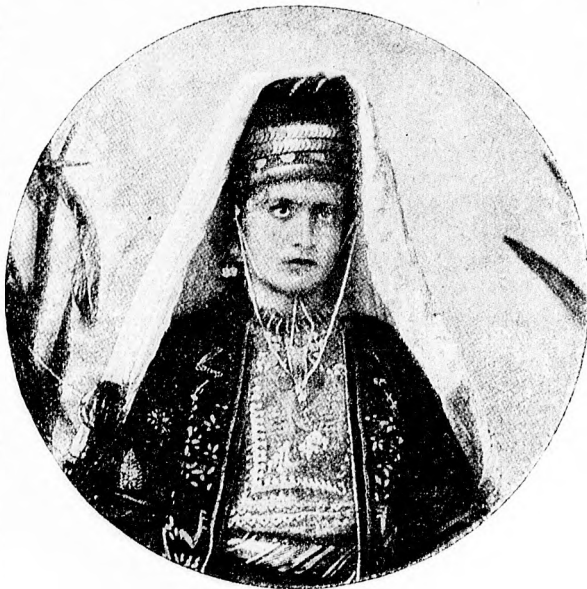
☞ Betlehemi leányka. ☜

— Hiszen, ugy mondták, hogy az első kordon 20 versztre van, 18-at már megtettünk; csak ne kerülnénk a kordon elé.