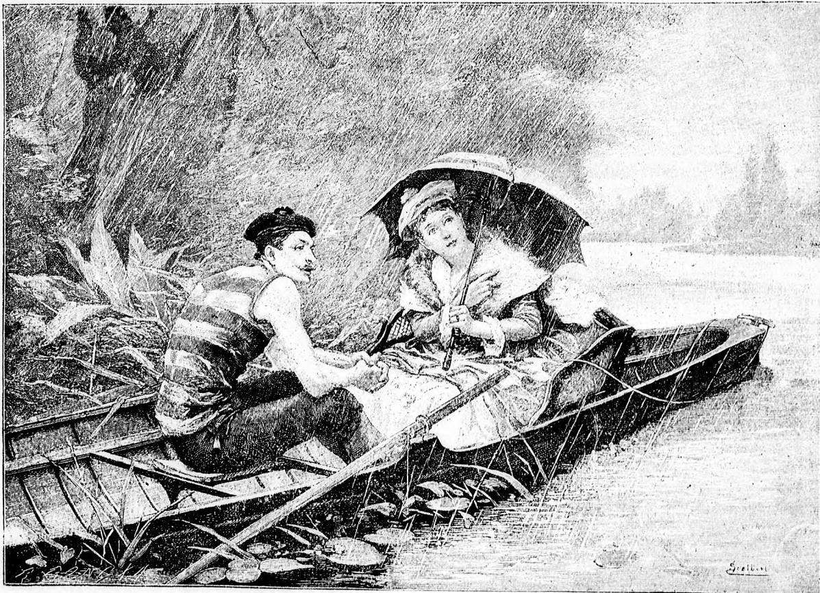
— Kettesben. —