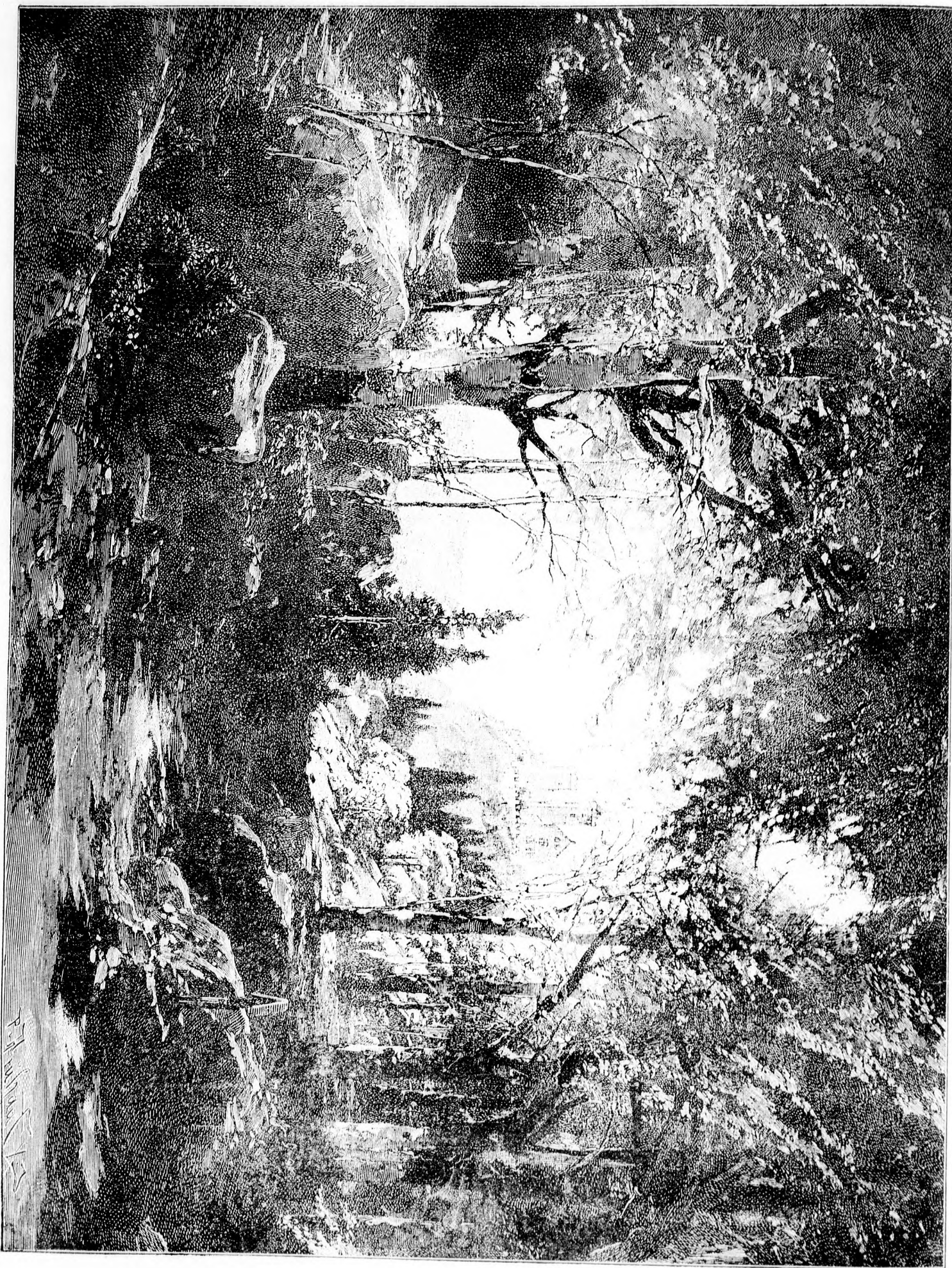
ÖSZI TÁJ. Öz