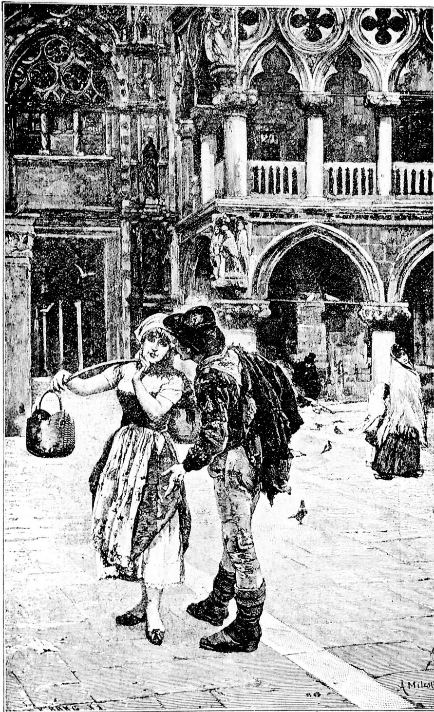
☞ Spanyol udvarló. ☜

Leo fölült ágyában. Feje zugott, s a reggeli zuhanyfürdő nem üdítette föl, nem hűtötte le föllázzadt véréit.