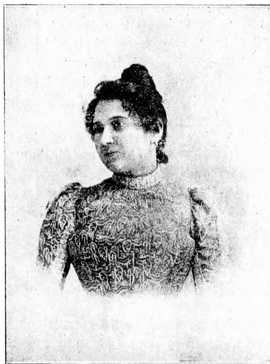
Dr. JÓKAI MÓR ÉS NEJE SZÜL. NAGY BELLA.

Ekkor léptek hallatszottak a hajóürből, a födélzetre vezető lépcsőn. Valaki jön!