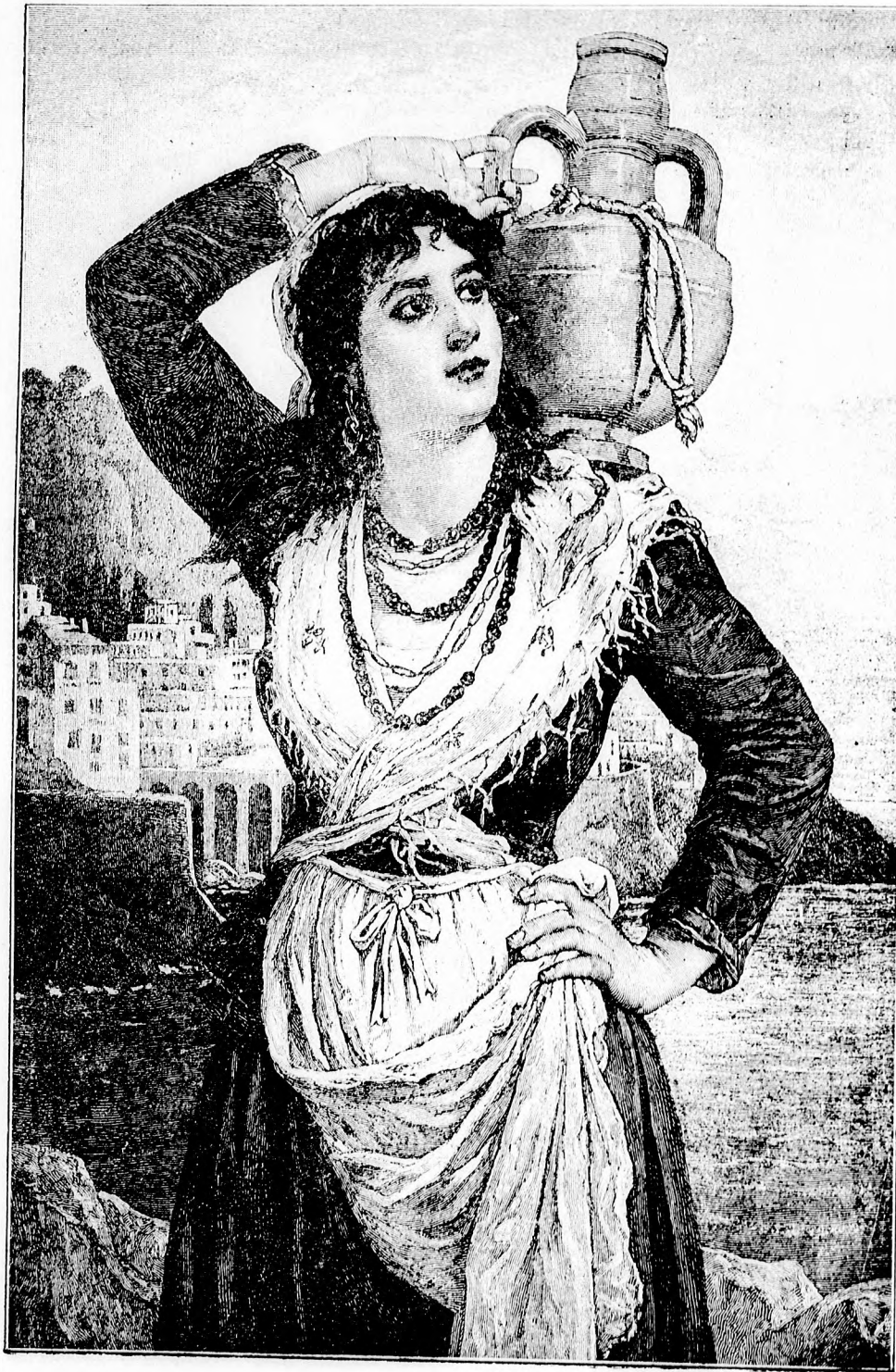
✻ Vizhordó leány. ✻

Lecoincheux : Csak nem gondolja, asszonyom, hogy egyedül töröm be ezt az ajtót?