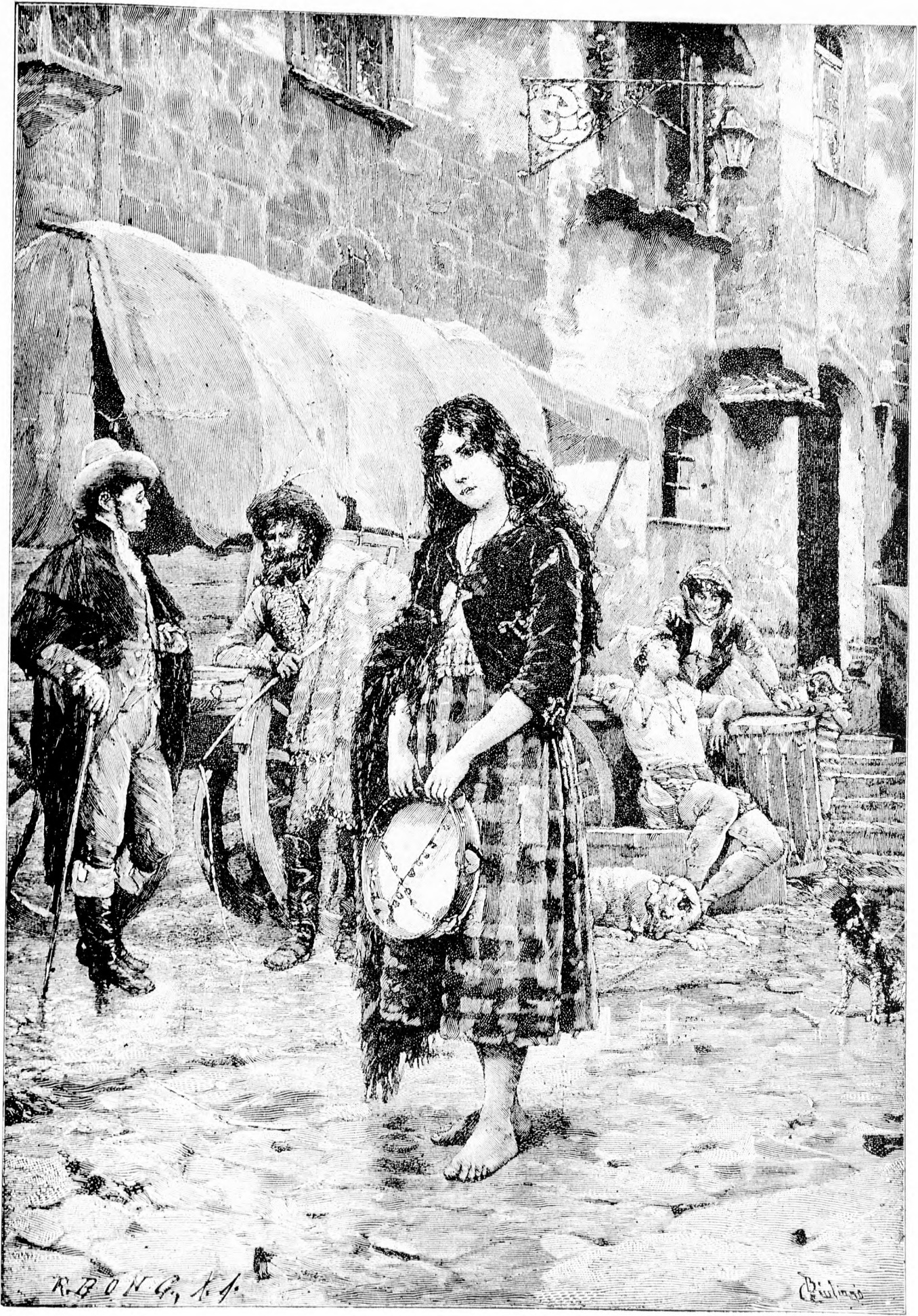
— MIGNON. —