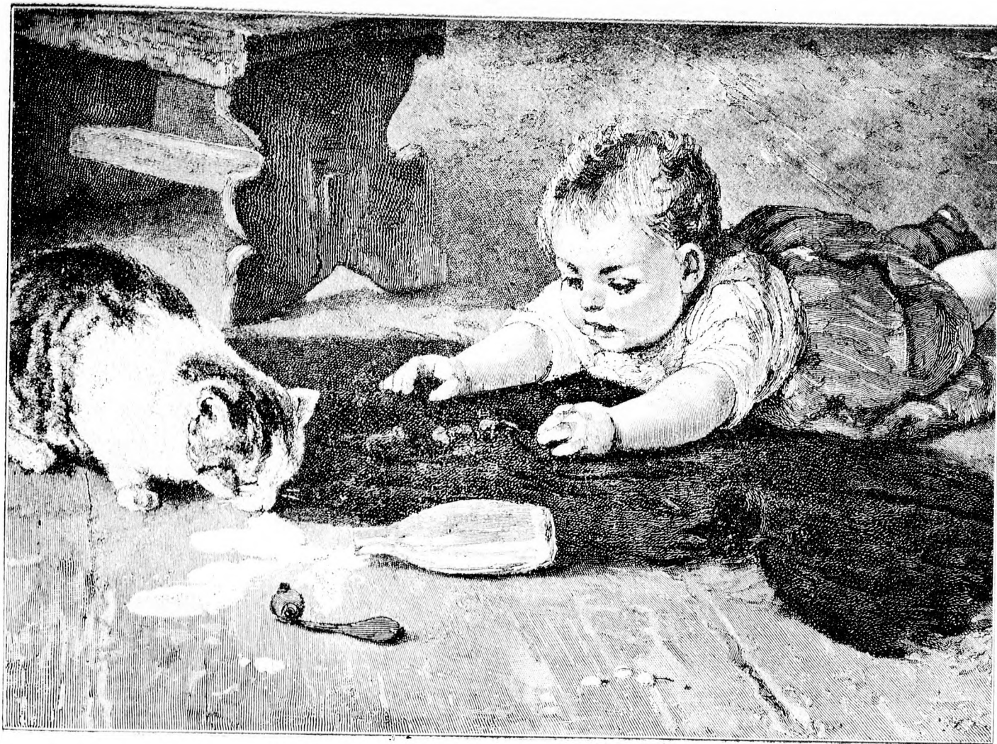
— Hivatlan vendég. —

— Azonban mindenesetre meg kell tennünk kötelességünket gyereünk, Ramageot!