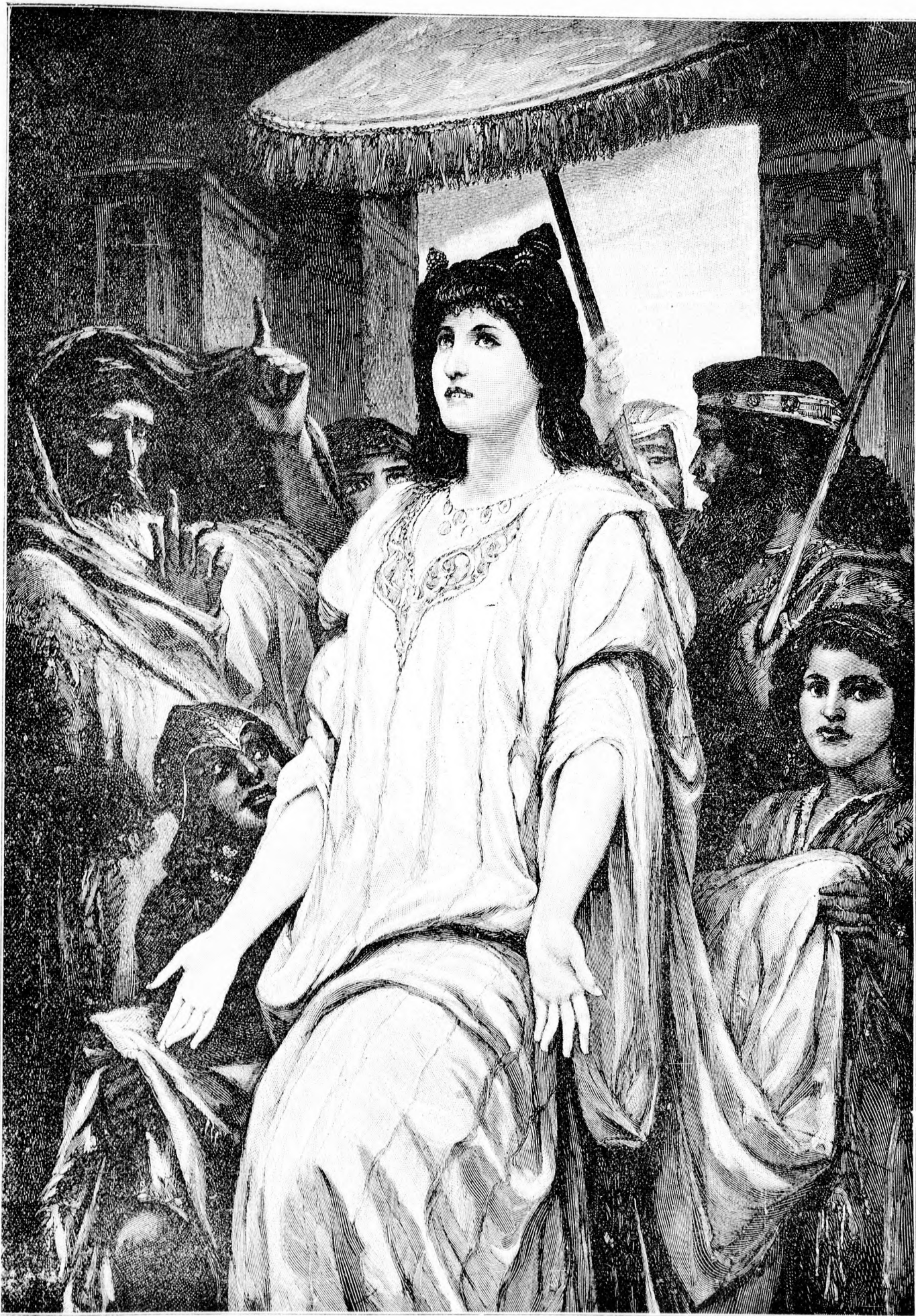
~*~ CLEOPATRA. ~*~