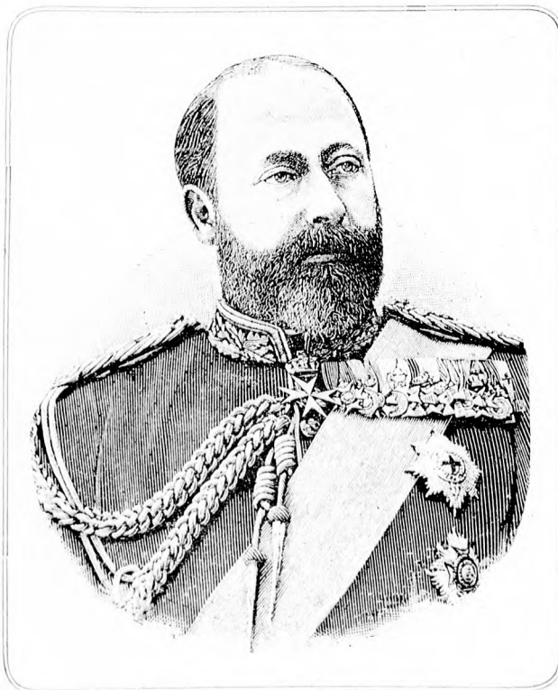
ALBERT EDUARD, WALESI HERCZEG.