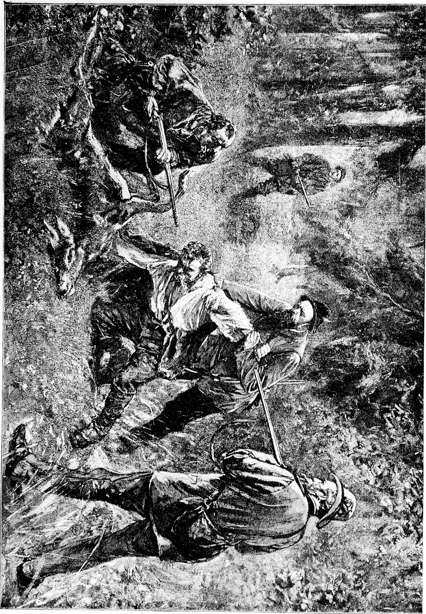
— A V A D O R Z O . —