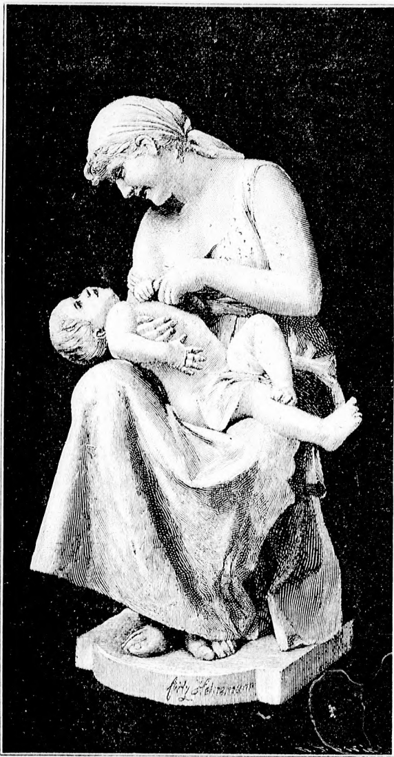
— Anyai örömk. —

Egyszer aztán egészen odaült közel, szemben velem, úgy, hogy szemeinek tüze perzselt, azok az élveteg, piros ajkak