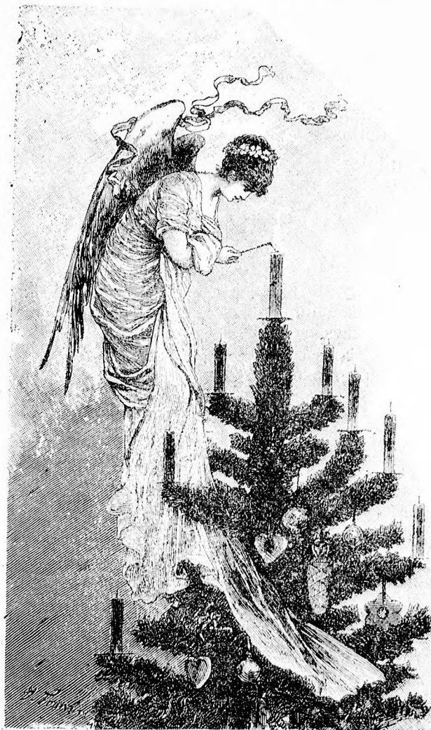
☞ Karácsony estjén. ☜

Megérkezett Uhlenfeldre, az udvaron egy kocsisnak dobta oda lova kantárszárát, s fölsietett a kastélyba.