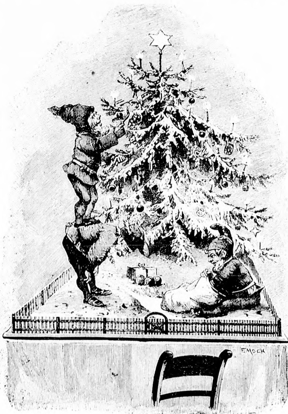
— A karácsonyfa díszítői. —

Leo hallgatott. „Tehát mégis elvetted engem!“