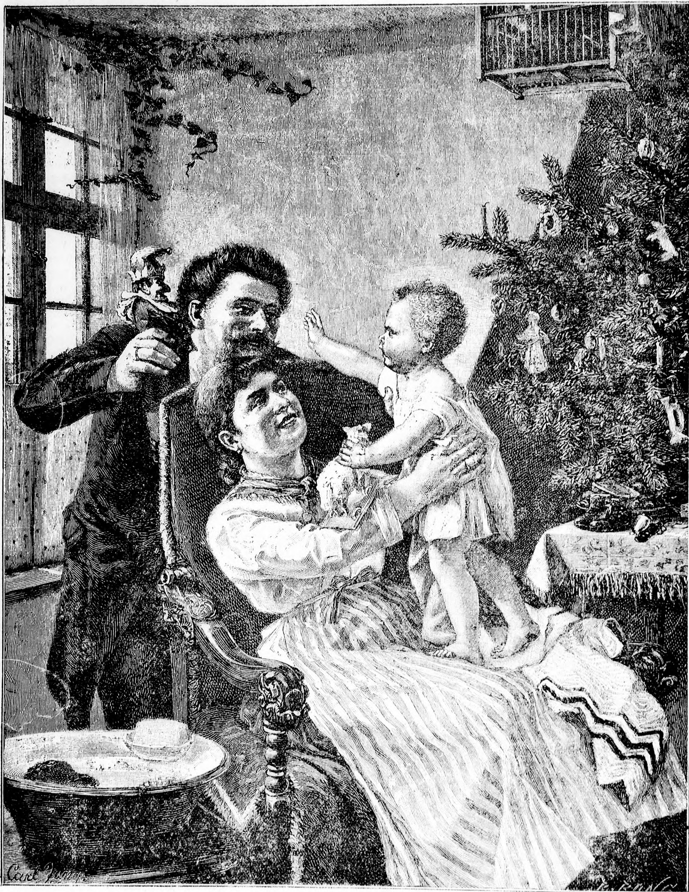
—♦— AZ ELSŐ KARÁCSONY. —♦—