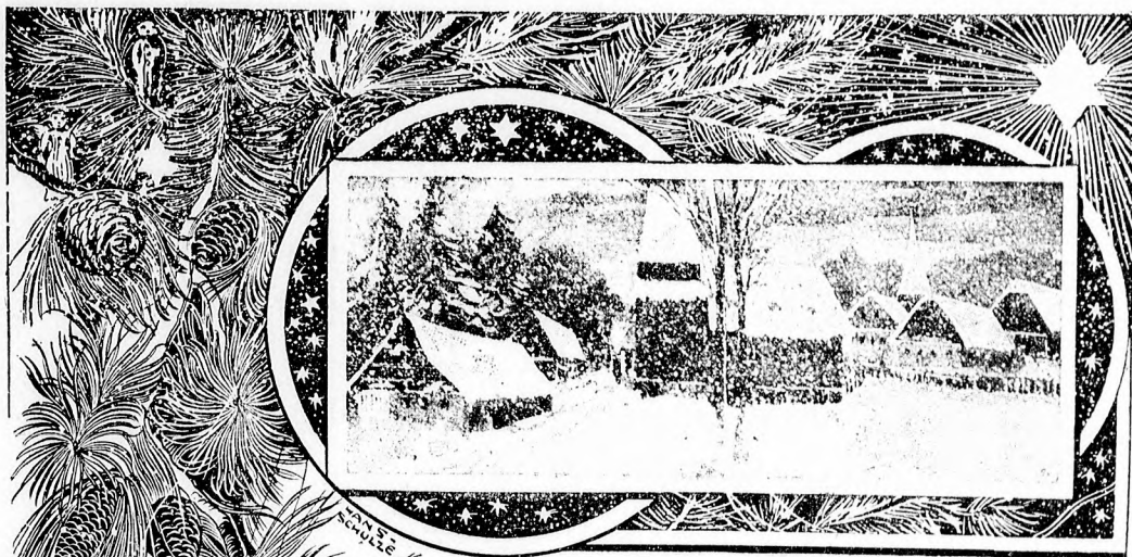
— Karácsony. —

Honnan, honnan sem, azt csak az ő szeretete tudná megmondani, de estére egy tuja bokor, mely szobánk egyedüli dísz volt, ott állott az asztalon, rajta apró kis viaszgyertyácskák, csak akkorák éppen, hogy pár perczig égnek, ha meggyújtják őket, egy-két báb lógott az ágain, s a bokor tövében sok-sok játék. Selejtes volt, egyiknek a feje hiányzott, a másíknak lába volt törött, a harmadíknak meg éppen csak a törzse volt meg, hanem azért, hogy ölelgettük, hogy csókolgattuk mi azokat a Jézuska küldte játékokat, de hogy vettük mi észre a hiányokat rajtuk. Aztán jött a vacsora!