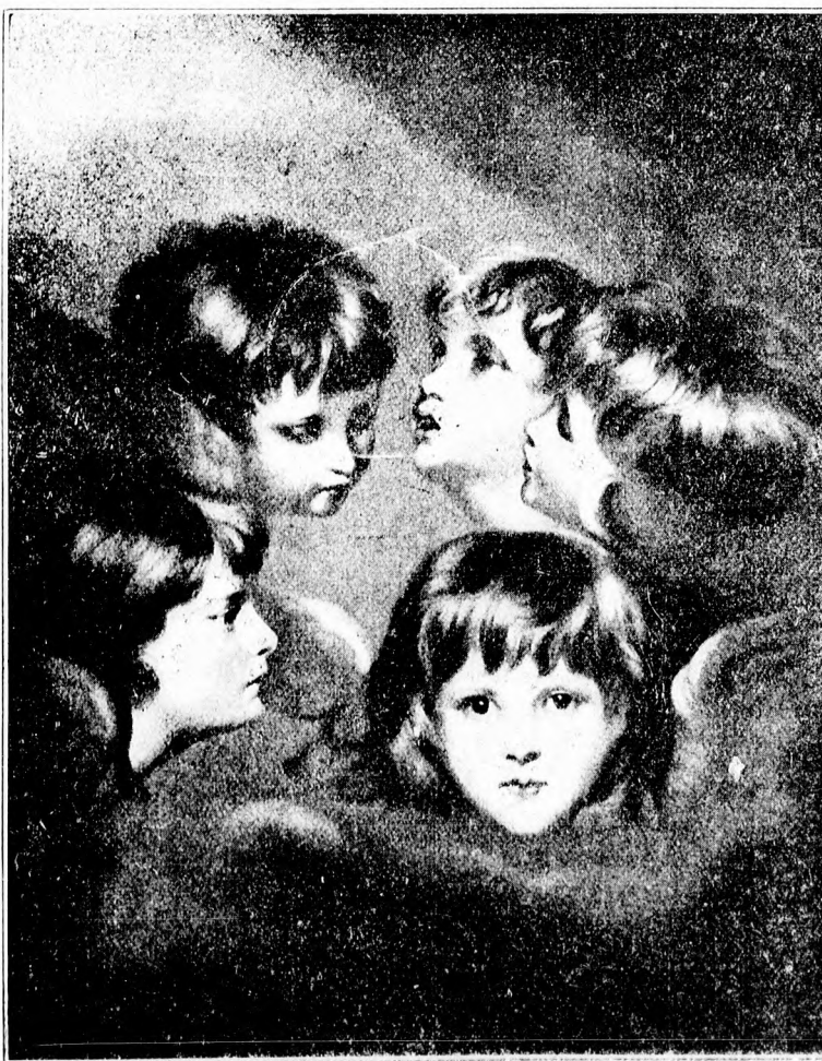
GLORIA IN EXCELSIS DEO!

A KONYHÁBAN csak tea- és kávé készítésre szolgáló edényeket láttak és az előszobában nagy szekrények álltak a fal mellett, melyekbe Gyurka az urak felöltőit, kalapjait és botjait vagy esetleg esernyőit szokta elhelyezni. Sehhol sem találtak valami gyanusát. Dorka néni hiába kereste az olvasztó kemenczét, az aranyesinálásra szükséges edényeket, — Máli asszony a koczkát és tiltott kártyajátéknak egyéb elárulóit, Milka az „Arany majom“ leányok által elveszített haj- és gombostűt, virágot, félkezyűt, szalagot és Lina a kincsására való eszközöket, semmit, de semmit sem találtak, pedig ugyancsak alaposan és tüzetesen vizsgálták meg mindent; nem kimélve az időt, mert már egészen bealkonyodott, Gyurka, kit mindjobban szorongatott a félelem s aggodalma perczről-perczre