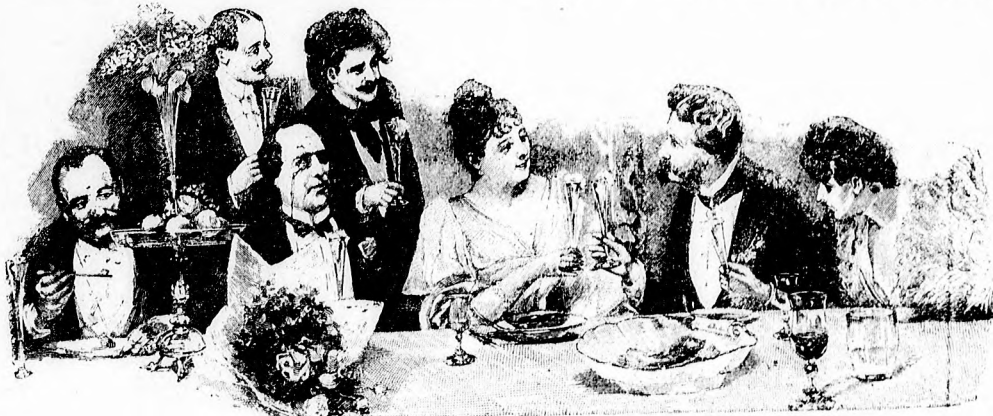
— Bövedestén. —

A falu lelkésze többször beszélgetett vele, nyájasan vigasztalta; azt mondta neki, ne adja oda elég keservesen szerzett, filléreit olyan nagy gyertyáért, megteszi a csekélyebb is, igaz, hogy nagy az ő bánata, de a jámbor buzgóság többet számít az Úr előtt a világ minden adományánál, a Mindenható nem nézi, mit áldoznak az ő oltárán, hanem azt, milyen az a szó, mely oda leteszi; csak az öreg pap volt jó szívvvel a szegény anyóka iránt s azzal vigasztalta, hogy a jó Isten az ő fián is csodát tehet. S az anyai szív hitt és remélt.