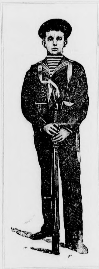
XIII. Alfonz spanyol király.

Tudott nélkülözni, szabad ég alatt étlen-szomjan durva szűrőn hálni. Hányszor járta be az országot áruhában, rongyos darócban, gyalogszerrel, túrva hőséget, szomjuságot és fáradságot! De amikor meg akarta mutatni a magyar király kincseit, gazdagságát és jóizlését, akkor bámulatos fényvel jelent meg. Amit akkor a világ művészete emberi kéz és elme remekébe csinált, azt mind összehalmozta Mátyás király budai palotájában meg a királyi nyaraló kastélyokban.