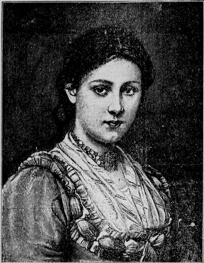
—♦ Tanulmányfő. ♦—

szikrája is, úgy hiszem, hogy e sorok elolvasása után elhagyja házámat, a várost, sőt a vidéket is.