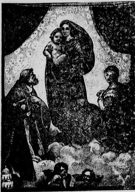
—♦— A sixtusi Madonna. ♦—

Noëmi nem minden gúny nélkül kérde Stein: „Miért nem lö ö is?”