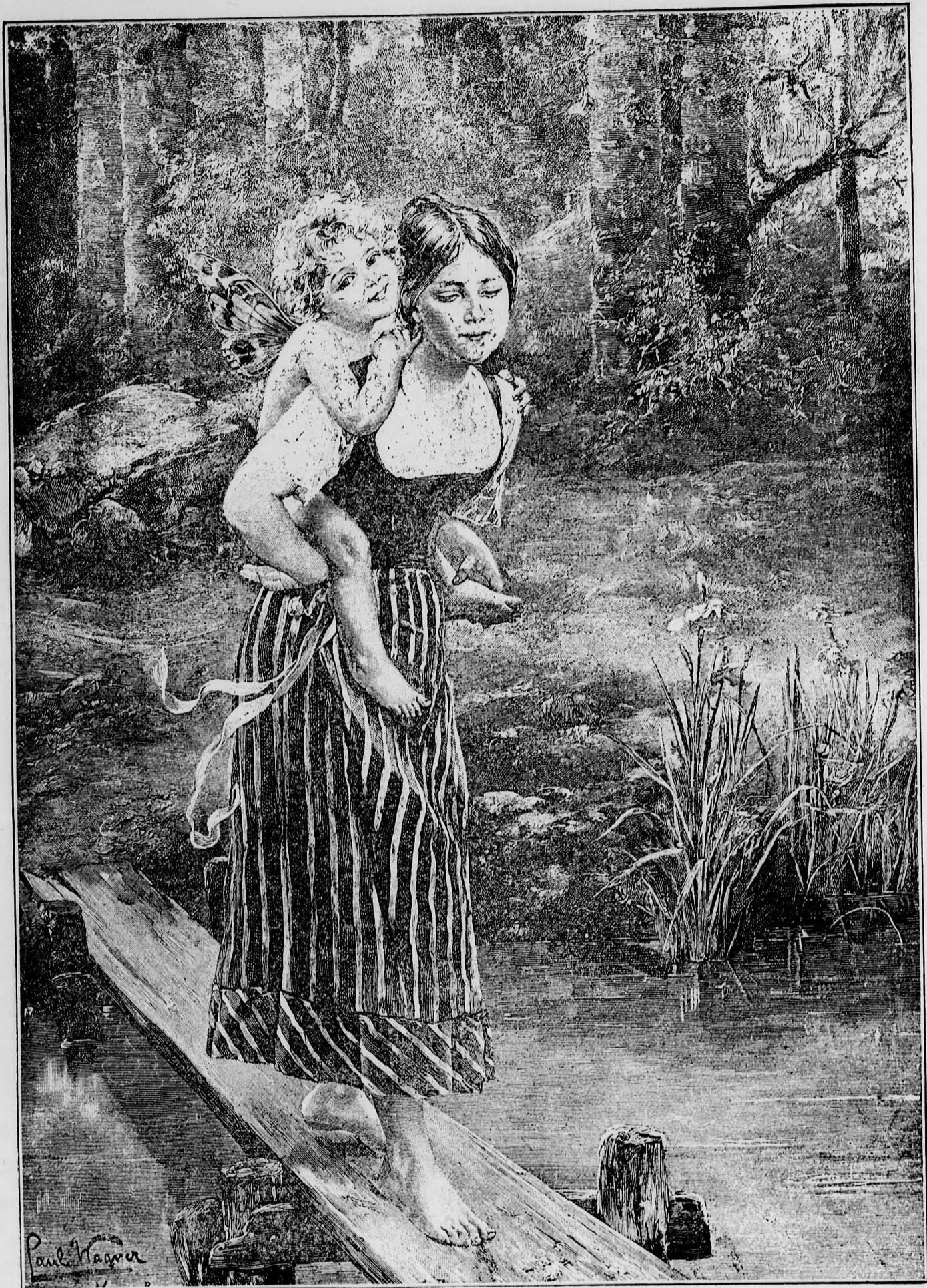
— Könnyü teher. —