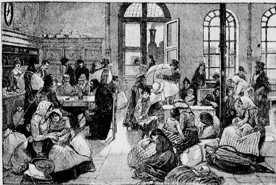
—♦♦ Kivándorlók útközben. ♦♦—

A tündező mult és felsedező jövő között élem családi jelenemet.