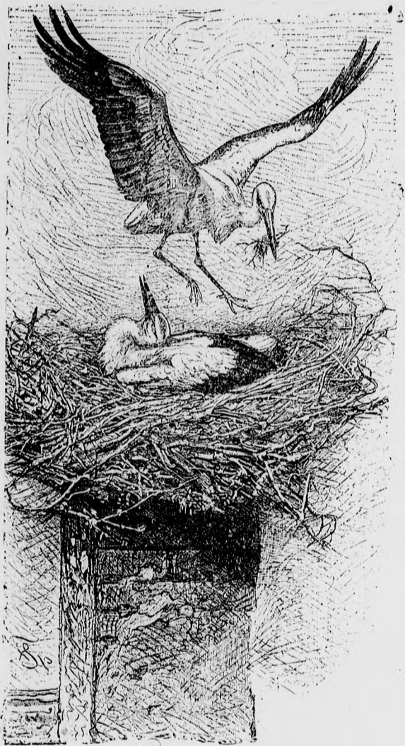
—••• Mejjöttek a gólyák. •••—

Ma mindegyik iparág kiáll a küzdőterre és külön palotát követel magának! És a hány palota van, mind megtelik szemkáprázató csodaművekkel!