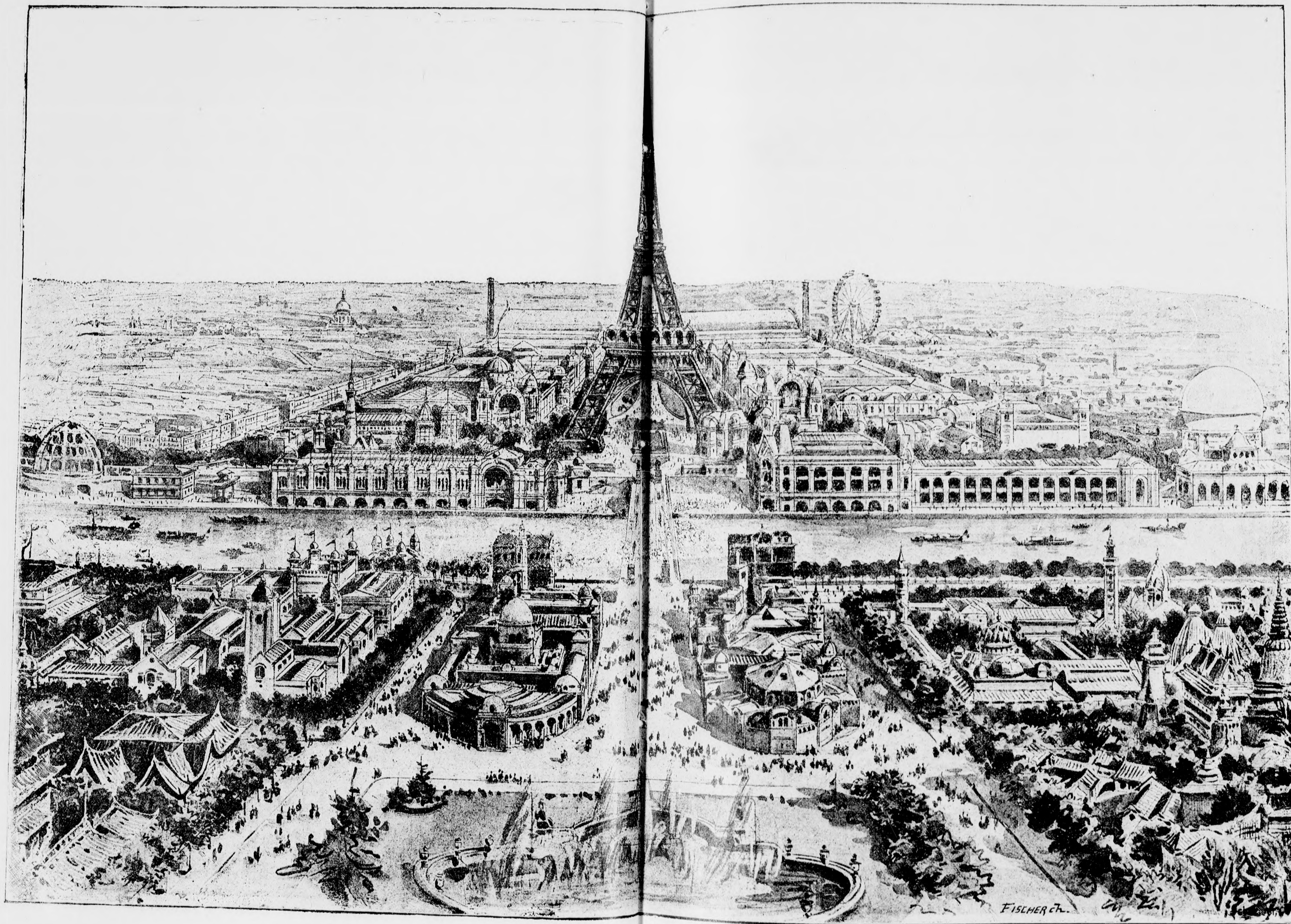
— ✦ PÄRSI KIALMITÄS LÄTKÉPE. ✦ —