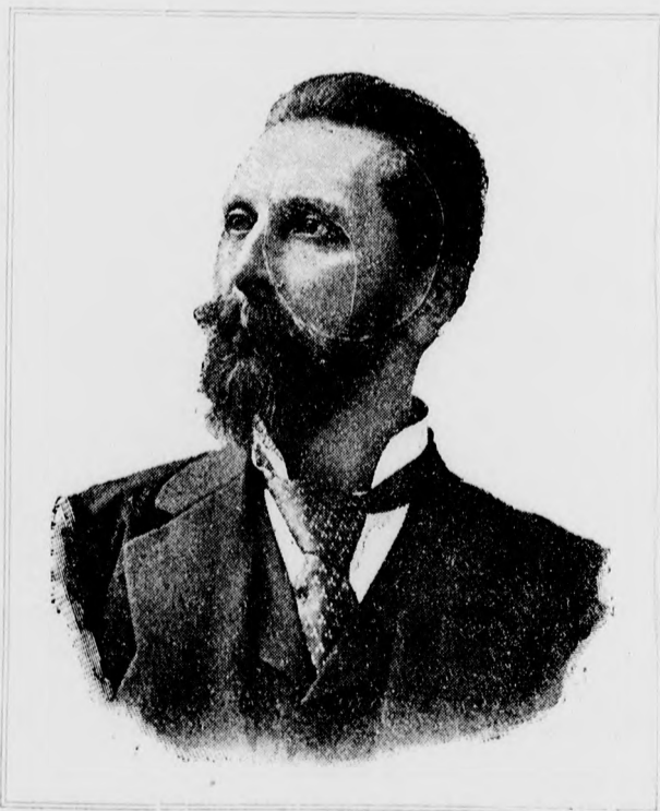
APPONYI ALBERT GRÓF.

Gyanított-e az öreg tábornok valamit, olvasott-e fia leveleinek sorai között olyasmit, mire neki tanácsadással kell szolgálnia? Nem tudók megmondani, annyi azonban bizonyos, hogy az ősz katonának eszébe sem jutott arra gondolni, hogy fia egy oly esztelen fogadást tett s ennek keresztülvitele végett óhajt csupán a Nagy ügyvéd házába bejutni. De igenis felébredt az öregben a kegyelet azon érzete, mely az igazi, önzetlen barátságoknak mindenkor kifolyása s e felébredt kegyelet érzeteinek benyomása alatt válaszolt fia levelére a tábornok, mely levél végszavai így szóltak: