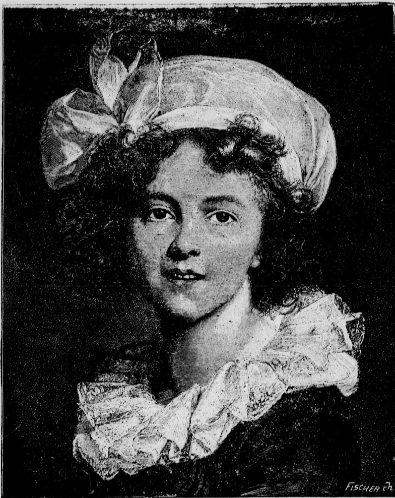
—♦— Kis kaczer. ♦—

— Jer hozzám, majd kapsz. Maradjunk most együtt.