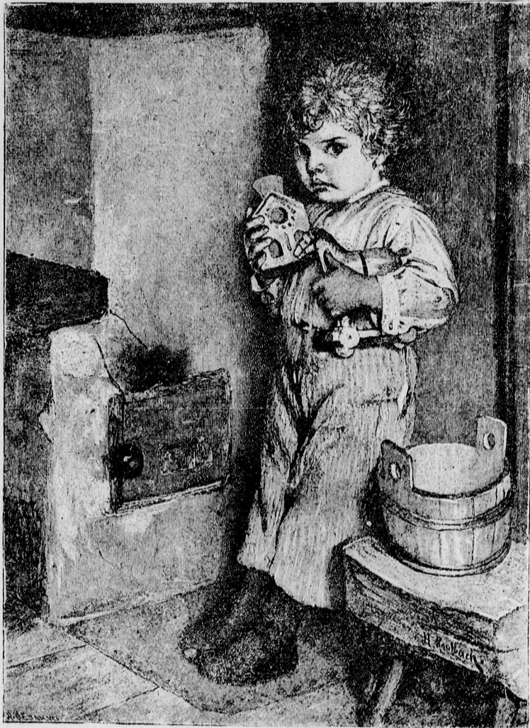
—♦— A kis mester. —♦—

Csak egy sorból áll, hanem ez az egy sor többet mond a