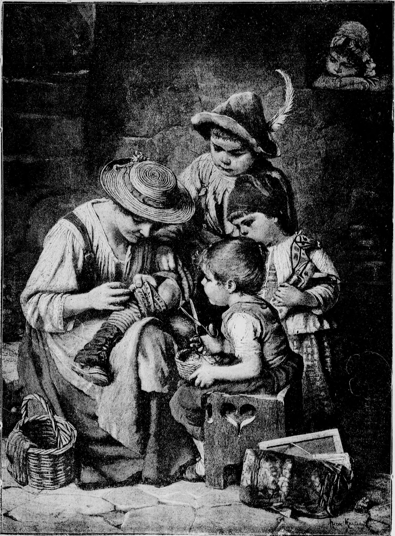
◆◆◆ A házi műhely. ◆◆◆