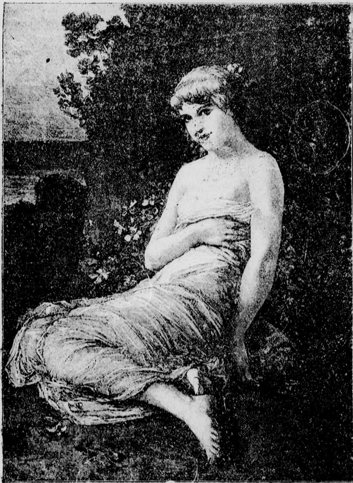
—♦♦ A patak partján. ♦♦—

Eszköze volt már akkor, midőn muzsája sugallatát követte. Öntudatlan, vak eszközzé lett az asszonyi szeszély kezében, mikor a „Marssal társalkodó murányi Vénus“-t megkomponálta.