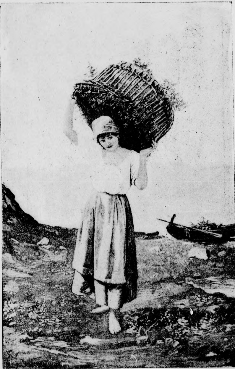
— Tengerparton. —