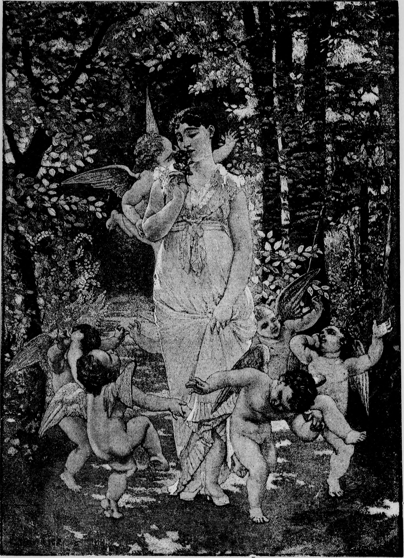
◆◆◆ Ábránd az erdőben. ◆◆◆