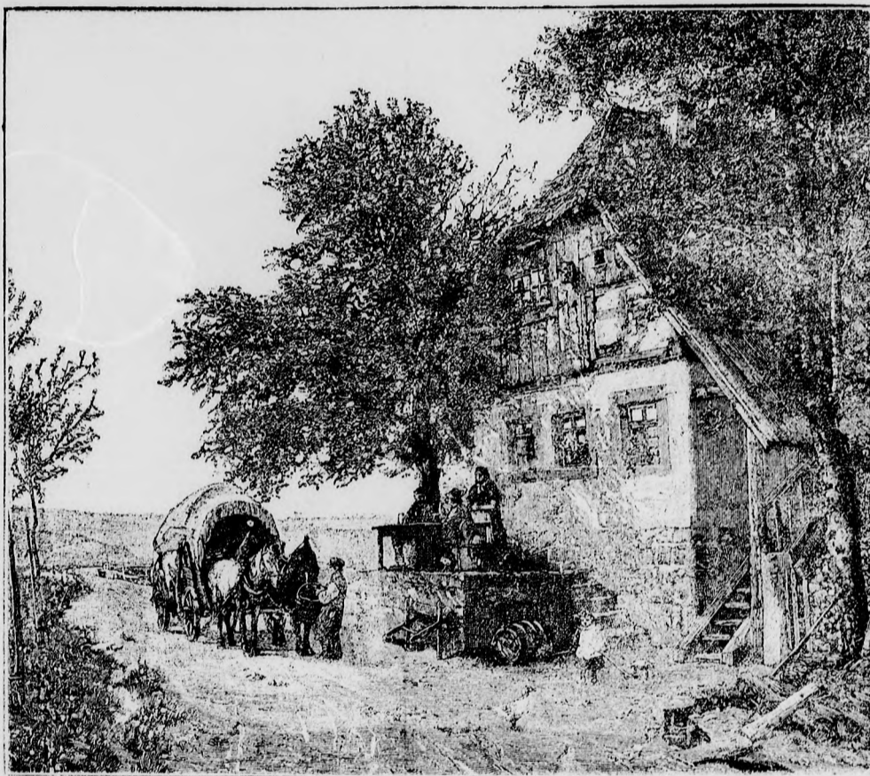
— Betérő csárda. —

Barátai czipelték magukkal és Gergely mulatni akart, de mikor legvigább volt, akkor szorult el egyszer a szive, akkor sirt föl a lelke. Az asztalra könyökölt és úgy zokogott.