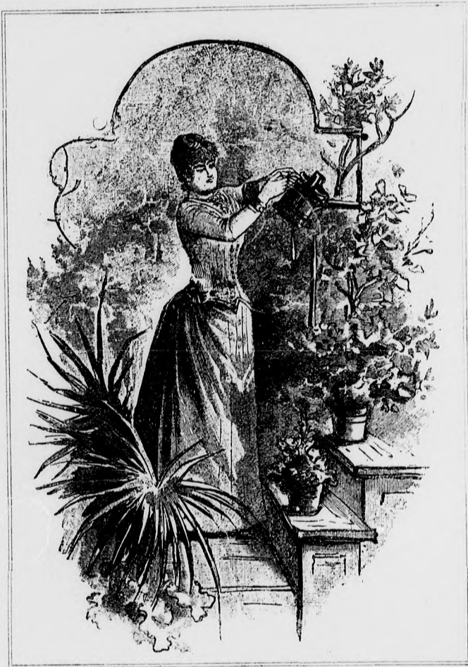
— Rózsa rózsái. —

— Nem! Olyan volt, mint egy orvos nejéé lehet, akinek meg kell szoknia, hogy a férj nem a nőé, hogy az atya nem a családé.