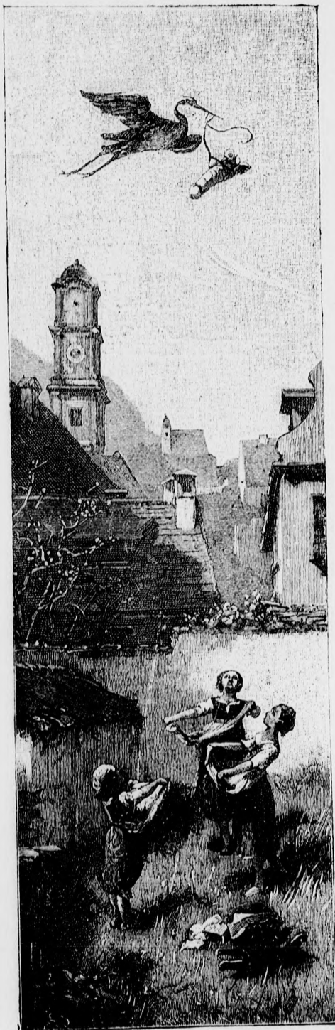
— A gólya meséje. —

Fejük fölött viruló ágon csalogány dalolt, üdvözletet hozzájuk. Ép akkor tűzött oda Erzsike finom ujján tün-döklő kicsi jegygyűrűre a mosolygó tavaszi napsugár.