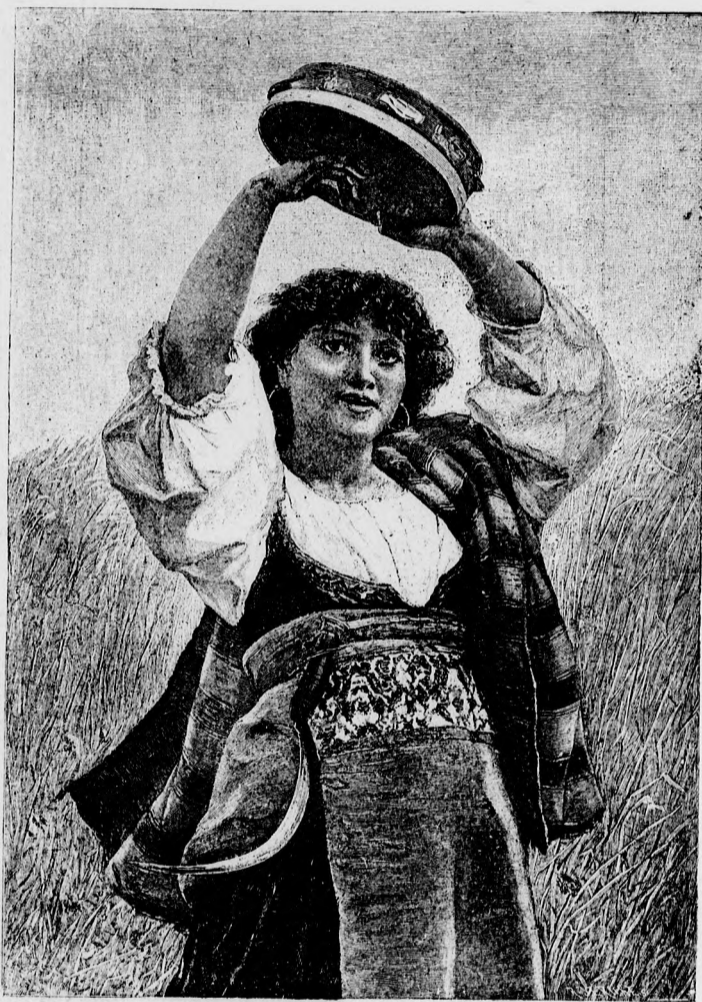
—♦— Déli csalogány. —♦—

— Uram, tudja meg, hogy nekem is van egy nevelőnőm, aki többek között arra is megtanított, hogy