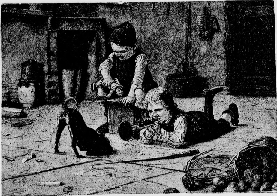
—♦♦ A három jóbarát. ♦♦—

Lendvay papa a méregetől köhögési rohamokat kapott. Olyan haszontalan, olyan praxis nélküli ember és biztosan fülig adóssággal, melyek még tanuló-korából származnak! Milyen vakmerőség! Bár be kellett vallania, hogy szellemében egy virágokkal diszitett oltár lebegett szemei előtt, mely előtt Erzsikéje térdelt, —