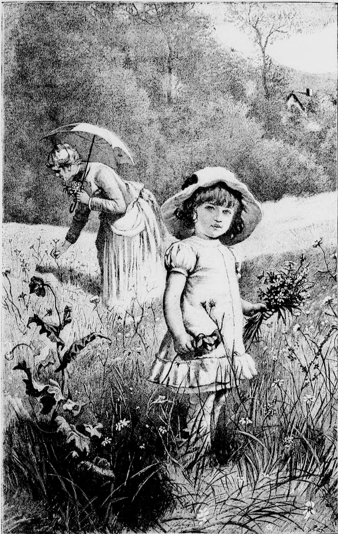
— Készül a csokor. —