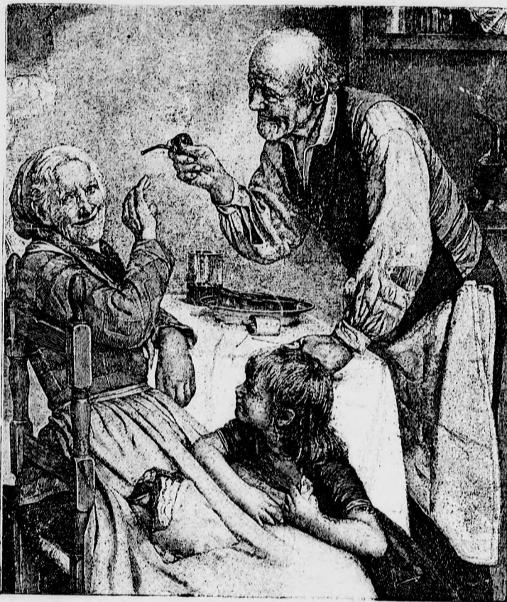
— Enylegő szerelmes pár. —

— Csitt, uram! Most már én mondom, hogy ne tovább!