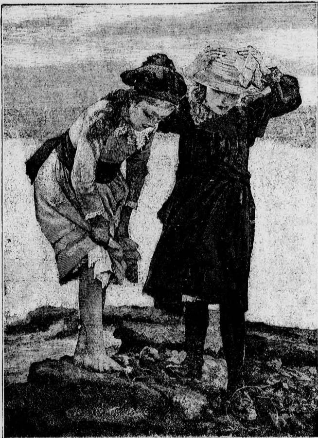
— Tengerparton. —

N incs unalmasabb dolog, mint délután négy órakor az ixembixemi állomáson kiszállni. Mindentűt pusztaság és pusztaság.