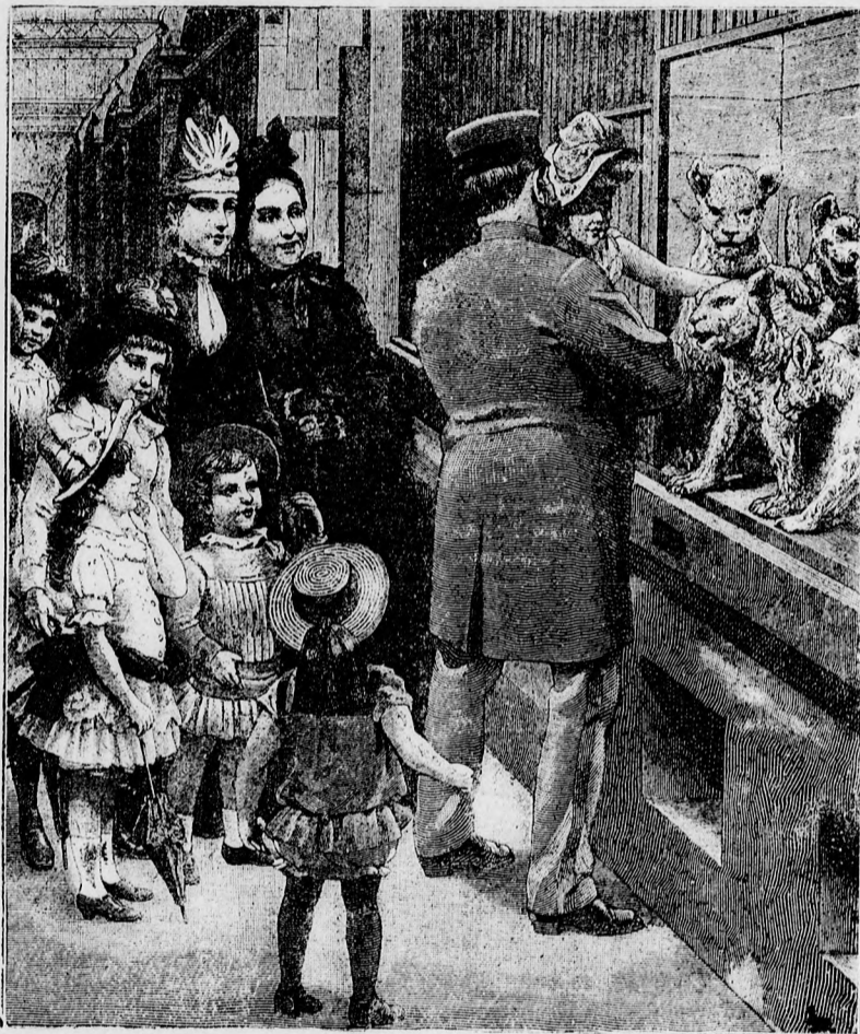
—••• Gyermek az állatkertben. •••—

Végtére mégis csak kibékültem a lelkiismeretemmel