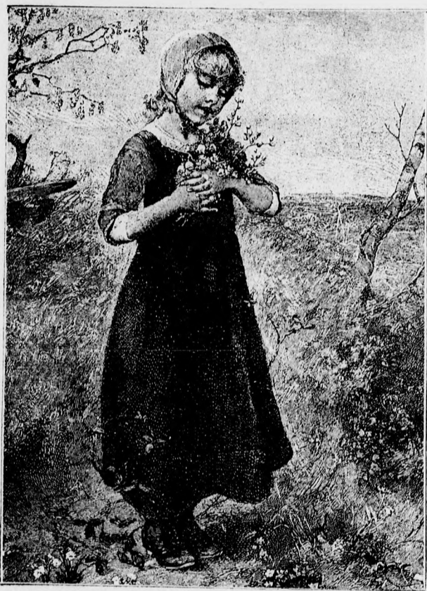
—♦— Vadvirágok. ♦—

— Ne vegye e körülményt, kisasszony, lealázónak. Atyja kívánsága különezködés ugyan, de nem lealázó, mert végtére is egészen mindegy az, akárki lesz is tanuja azon ténykedésnek, mely kegyedet boldoggá teszi,