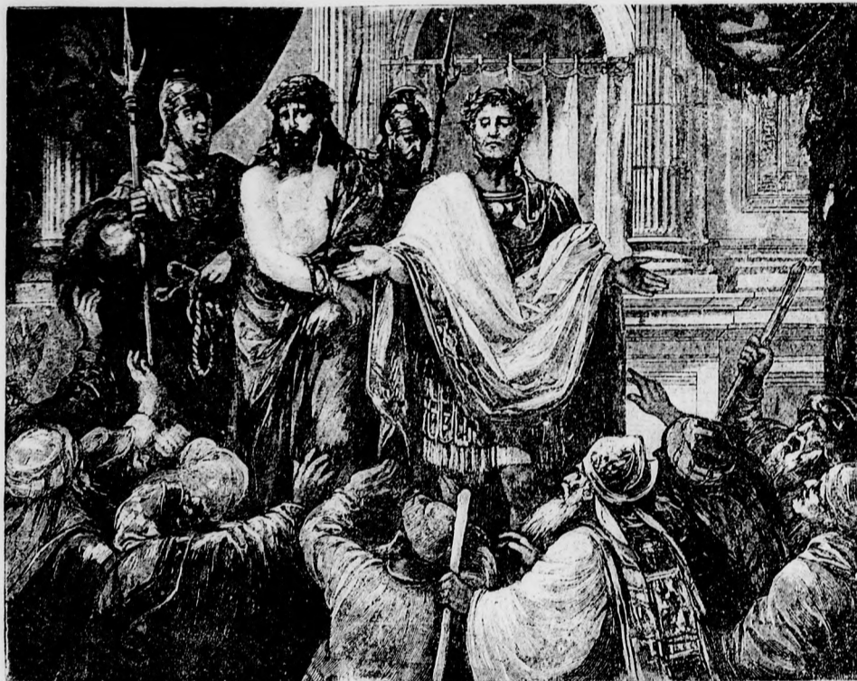
—••• Krisztus Pilátus előtt. •••—

Az anyja, minthogy ezekből sejteti, felületes, cocette divathölgy volt, az apa száraz üzletember, a leány egy főnhéjazó, tartózkodó hercegnőske, meg-