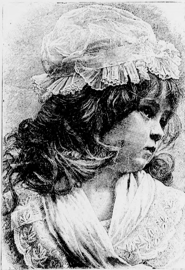
A CSALÁD KEDVENCZE.

ritkábban mutatkozott a kastélyban, pedig aligha eszeágában is volt e miatt Terézzel végkép szakítani. Ő is azok közé tartozott, akik azon hitben élnek, hogy akit az Istenek bármi más halálra ítélték, nem fog a hullámokban elveszni. Ő sokkal jobban szerette a lelki nyugalmat, hogysem azt bármi nem várt eshetőségért könnyelműen feladja. Csak akkor lett kissé lehangoltabb, mikor atyja, az öreg gróf jutott eszébe, akiről biztosan feltehető, hogy ha a Terézzel való egybekelése meg nem történik, aligha lesz képes többé egy másik leánnyal történt egybekelése által megvigasztalni. — Alfonz tehát legfeljebb oda törekedett, hogy atyja ne őt vádolhassa a többé helyre nem hozható házasság meghiusításáért.