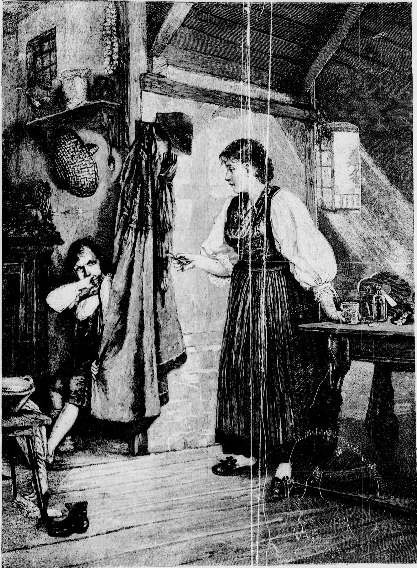
— Nem kell orvosság! —