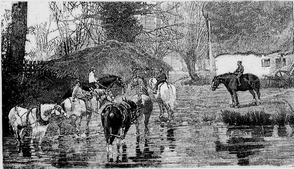
—•• Lovak úsztatása. ••—

Én Titusszal 5 percig beszéltem, nem tovább.