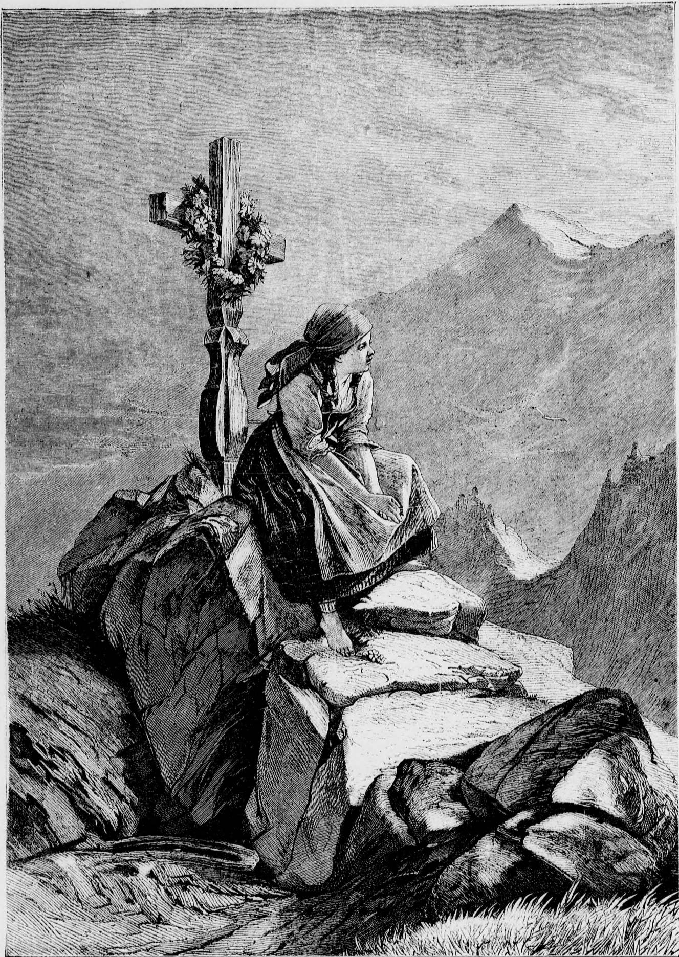
— Hajótörött siremléke. —