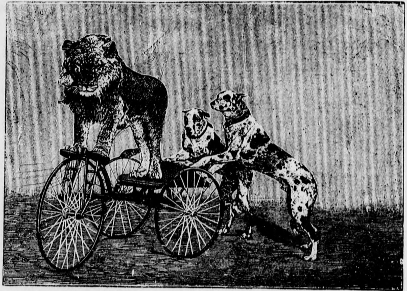
— Az állatszelistítés csodái. —

a nehéz, sorvasztó gondokat, melyek annyira megvénytették rövid idő alatt.