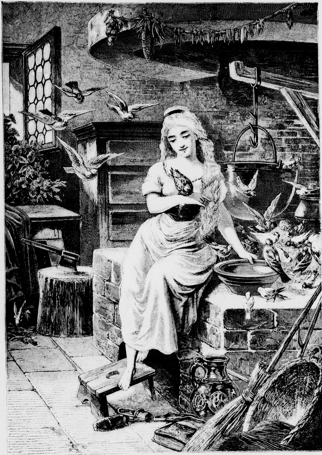
—*— Hamupipöke. —*—