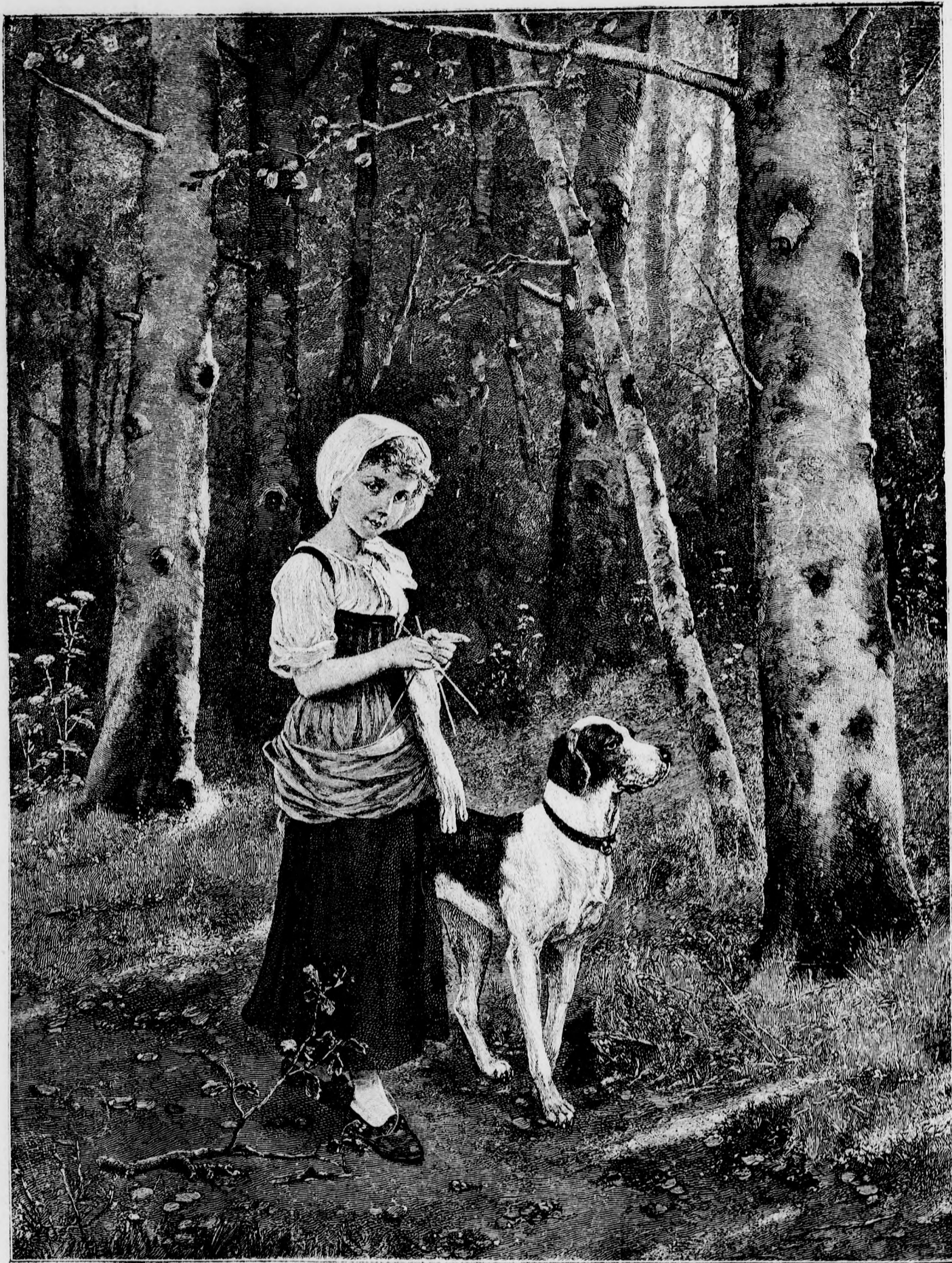
—*— Seta az erdőben. —*—