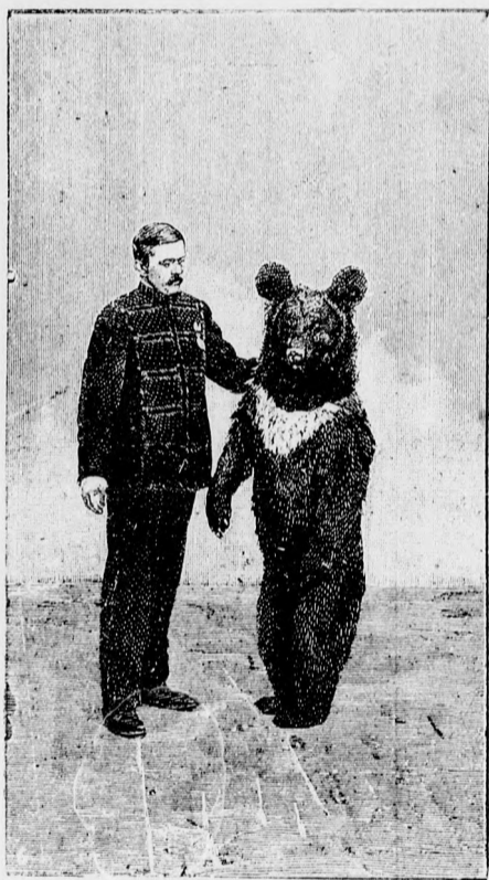
Az állatszelistítés csodái.

Senki ezt olyan ügyesen meg nem tehette volna, mint a Figurás hajdu, a vén kiszolgált huszár, kapott is érte egy forint borraivalót az aljegyzőtől. Ezt a „rókanyulat” aztán a kis aljegyző