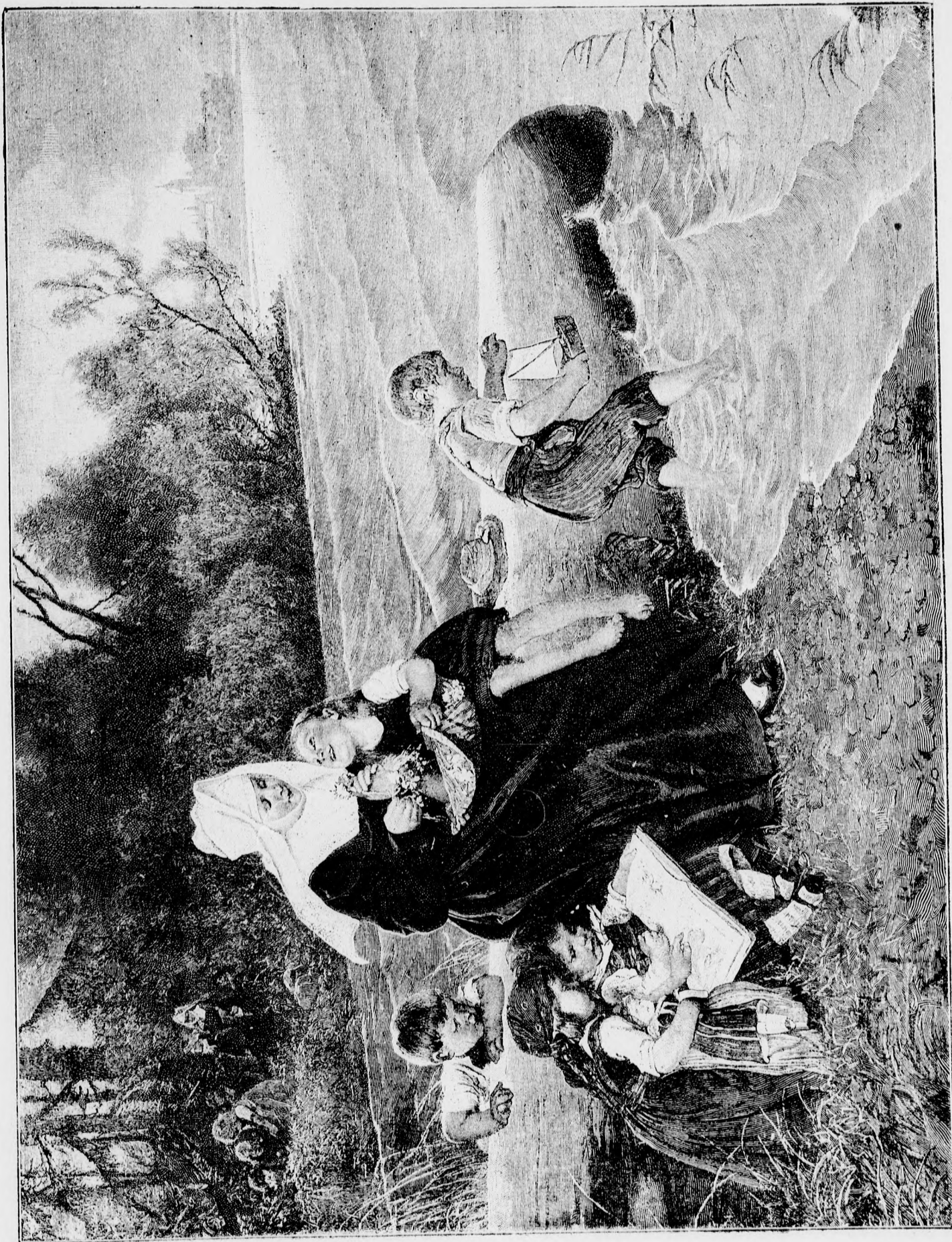
— Árvaház kiránduláson. —