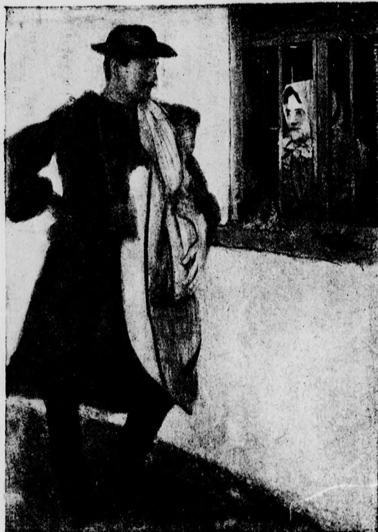
Idyll a Hortobágyon.

— Én még különb legény voltam, mint te . . . — Oh, beszélte atyám, a himlő csak később . . . — Kitűnő ügyvédi diplomával jöttem haza s reszketett a szívem örömeiben, hogy egyenesen a régi szeretőmhöz repülhetek. — De meghalt, ugy-é? — Most is él, valami szegény rektorné Baranyában! Sok gyermekkel . . . — Apám megállított. Fiam, mondá: az egész Jánossy-család koldus, te szép fiu vagy, nagy tánczos, híres énekes, muzsikus, szednéd össze az eszedet. Ma délután elviszlek a Sánta Nagy Jánoshoz Bodokra. Az áll kétszázezer pöngő forintig. Egyetlenegy leánya a Ráki. Ez a lány ösmer tégedet s azt mondta: hozzád menne. Menjünk el, mutasd be mit tudsz s ha messzebb látsz az orrodnál: a megye első embere lehetsz. — No, de első embere is a kedves bátyám. Már az igaz. Nincs olyan tisztesség, amiben a megye ne