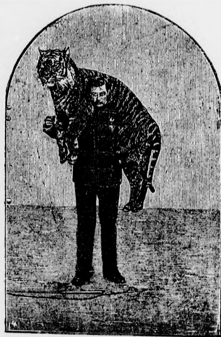
— Az állatszelistés csodái. —

Alig győzték dicsérettel, mindenkinek tetszett, de különösen a kis Polluxnak, aki úgy izgett-mozgott ülőhelyén, mintha parázs volna talpa alatt. Neki mindig csak a felesége kívánsága, no meg az ő óhaja volt szeme előtt.