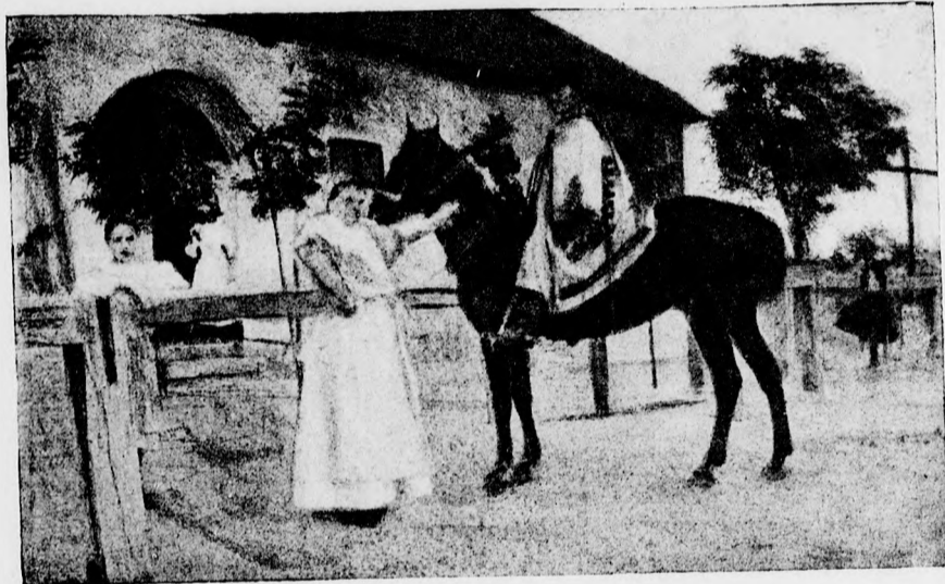
Csárda a Hortobágyon.

— Kire árulkodott, hogy ilyen dühbe jött?