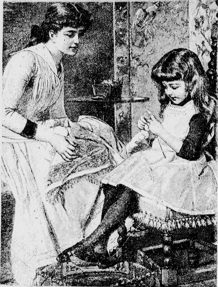
Az első kütés.

A legidősebb Holpach-leányért eljött a tintásujju iródiák, aki vizet iszik s versekkel és cziterával pótolja az ebédnél a hiányzó pecsenyét. A középső leányt is főköttő alá segíté a jómódú kulcsár, akinek a kancsójából ki nem fogy a sör: maga is megáll a talpán, amikor nem fekszik. Egy kicsit rezes ugyan a pofája: de ez a jó életmódtól van.