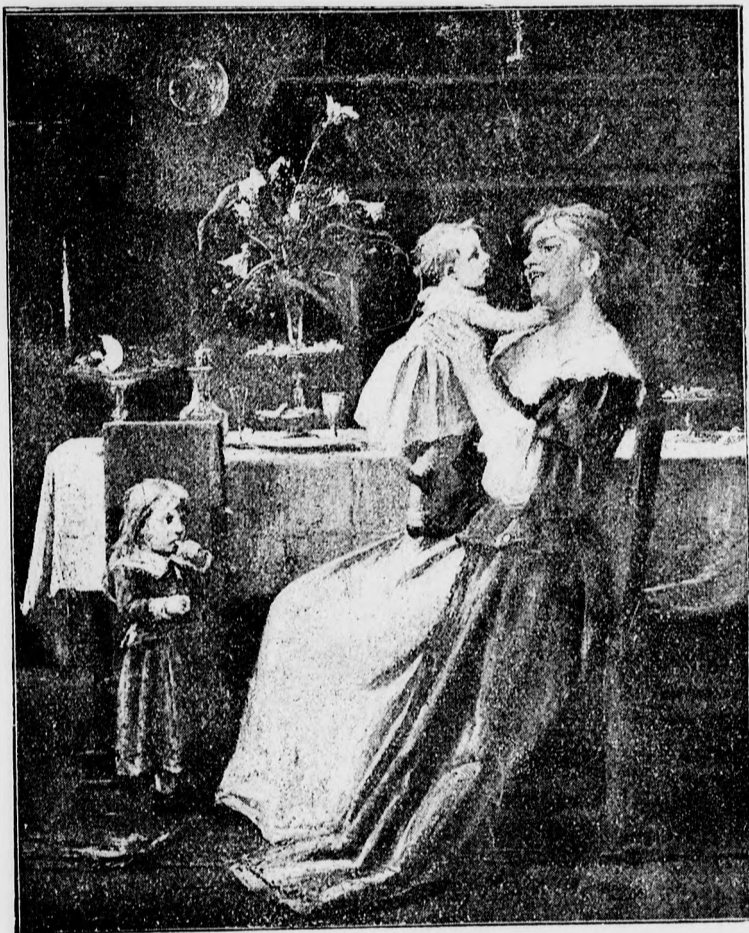
Munkácsy Mihály: Anyai öröm.

— Jól van, Petur, üzend meg Zuzónak, csak jöjjön a násznéppel, várom.