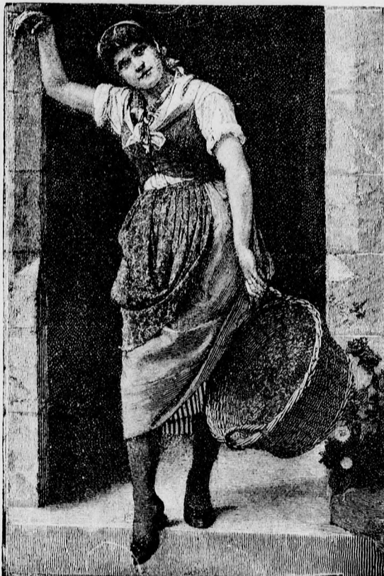
„Ő“ reá gondol.

Már mivelhogy én is amolyan fűzfánfütyörgő, kenetlen poéta vagyok, elmondom önöknek hiven, miképen keletkezett, vagyis miképen született meg agyamban az én legelső versem. — Mint afféle fiatal ember, aki még nincs abban a kellemes helyzetben, hogy magát egy egész életen át leköthesse szive választottjával, én is szerelmes voltam. Szerelmem bálványa egy, legalább előttem, a világ legszebb szőke leány szépsége volt; ugy szerettem, hogy sem éjjelem, sem nappalom nem volt, mindig csak ő, meg ő volt eszembe szüntelenül s ha legalábbis csak egy percze nem láthatam őt, azt gondolám, hogy a mennyeknek a kapuja