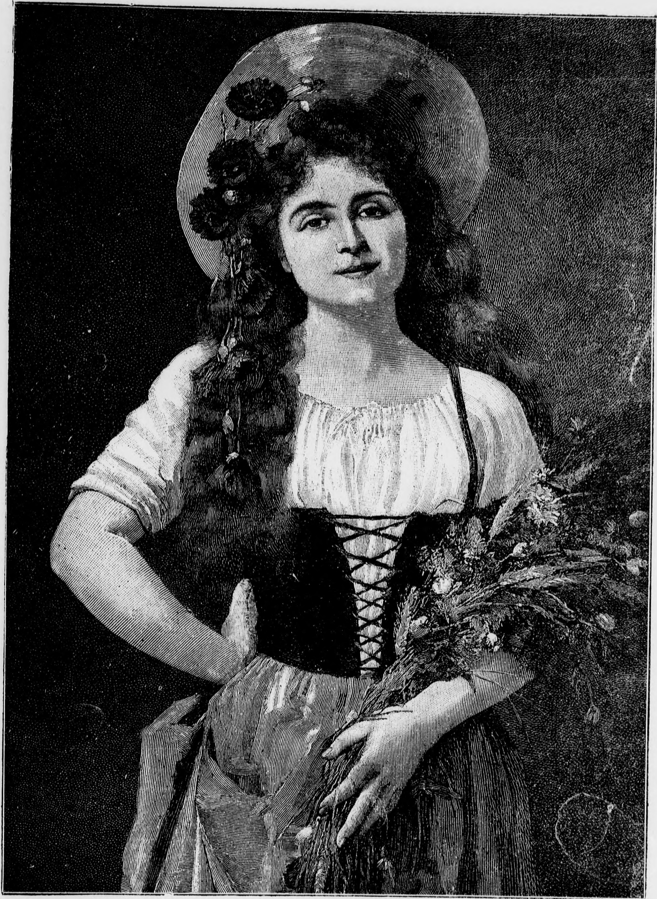
—❖ Téli virágok. ❖—