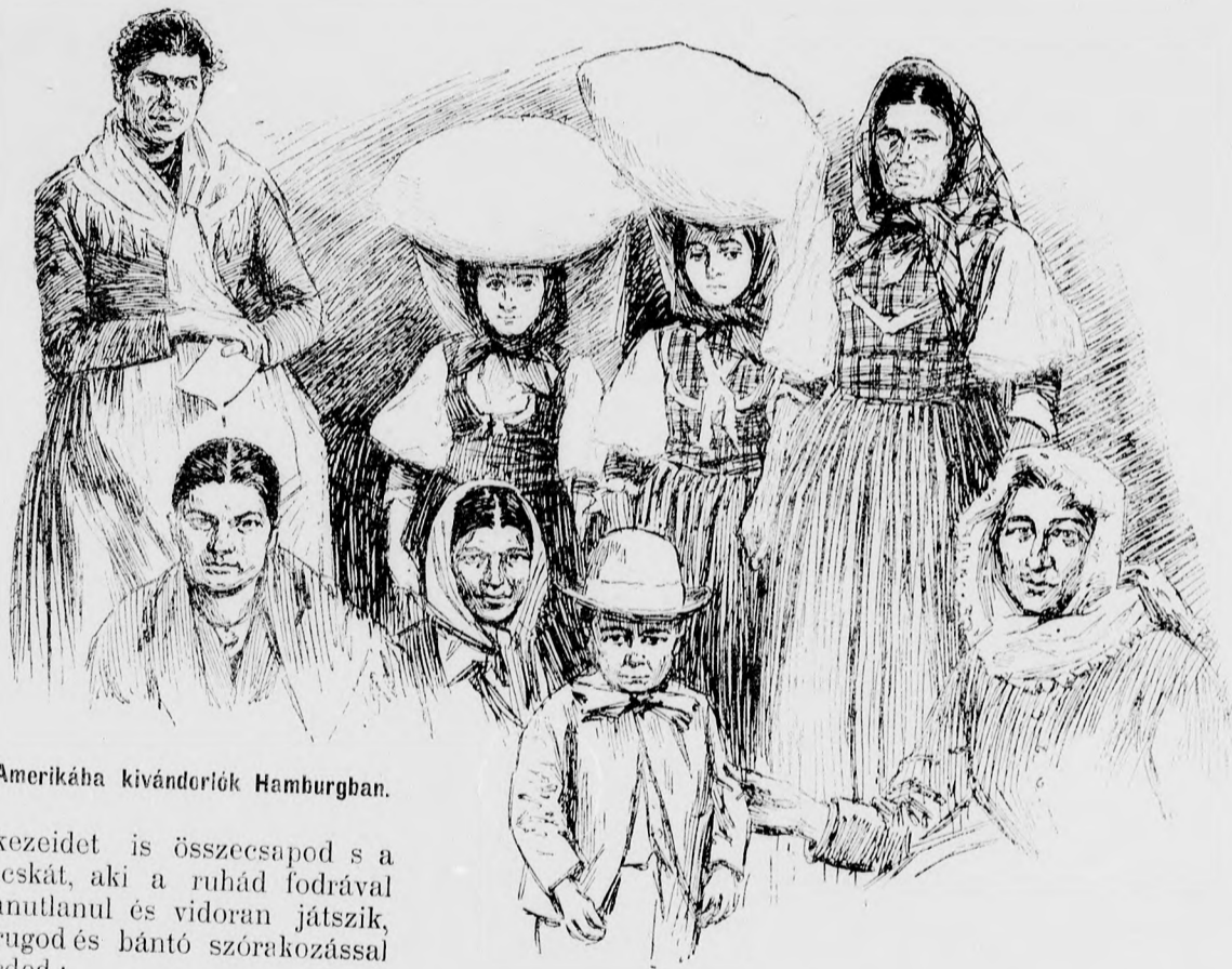
Amerikába kivándorlók Hamburgban.

. . . Éjnek évadján — elmaradva egy mulató kompániától — a „Három rózsába” vetődtem. Ott találtam a hadnagy urat rengeteg sok üres üveg mellett,