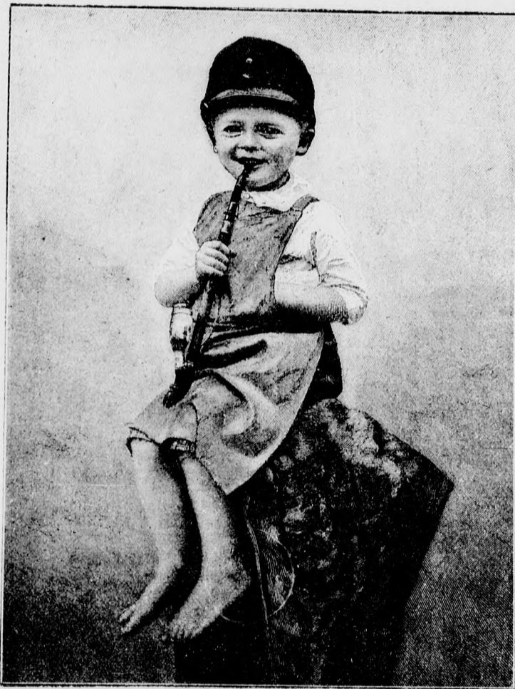
Ejnye, he jó!

A Kútvölgy oldalán bizarr alakokká képződött szakadékok között, amely bár magaslaton van, nem egyéb, mint egy bájos völgy Mára és Sándorfalva között, részben ibolyaliget, másrészt pedig sűrű erdő szilvással dekorálva, hol néhol a magaslat oldaláról