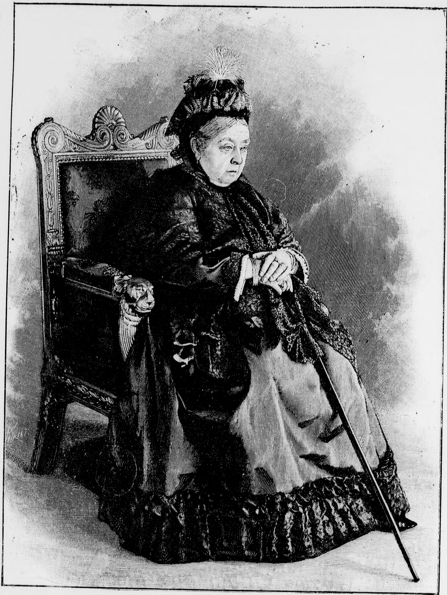
VIKTÓRIA ANGOL KIRÁLYNŐ.