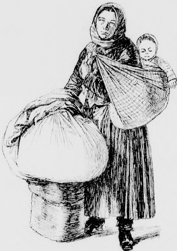
Kivándorló magyar nő.

Majd megtudod máskor, — viszonzá szomorúan Nyerges Lázár, — de annyit mondhatok, ha még egyszer legény lehetnék, ha olyan szegény lennék is, mint akár a templom egere, s nem