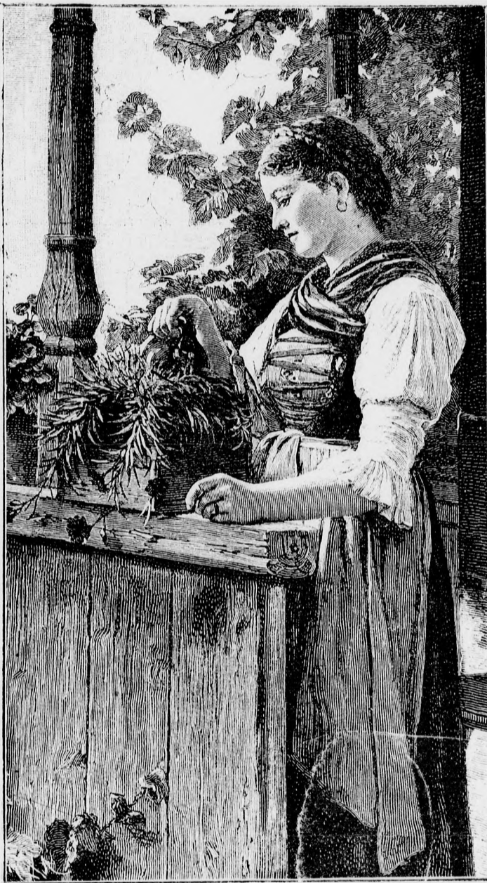
Hosszú a három év.

Hanem katonáéknál ez máskép van. Nekik nincs semmi érzékük a gyöngéd érzelmek iránt, ha ez zala-