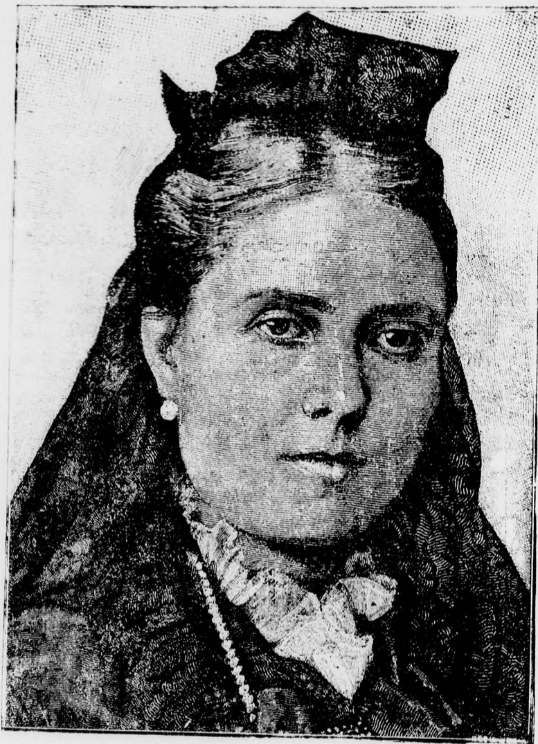
Frigyes német császár özvegye †

iránt nem érzett többé, nevezé az boldogságnak, nép, kinek kezében nagy pénz volt a batka, s egy kopott papirosrongy megtakargatott kincs, s kinevezé ezt nemzetgazdaságnak; nép, ki a csatából megfutott, ki ellenségének nem merte arczát megmutatni, s nevezte azt hősi vitézségnek; nép, kinek leányai kikacagták a haza eszméjét, bolondultak a külföld bálványai után, utálták hazájuk földét, nemzetük nyelvét, apáik sirjait, őseink öltözetét, s ki nevezte ezeket anyáknak; ki megengedte nekik, hogy azon szívet, mely a honszeretetet nem ösmerte, szerelmet, édes kéjt tudjanak ösmerni, minöket más nőknek szabad érezni, kik előtt