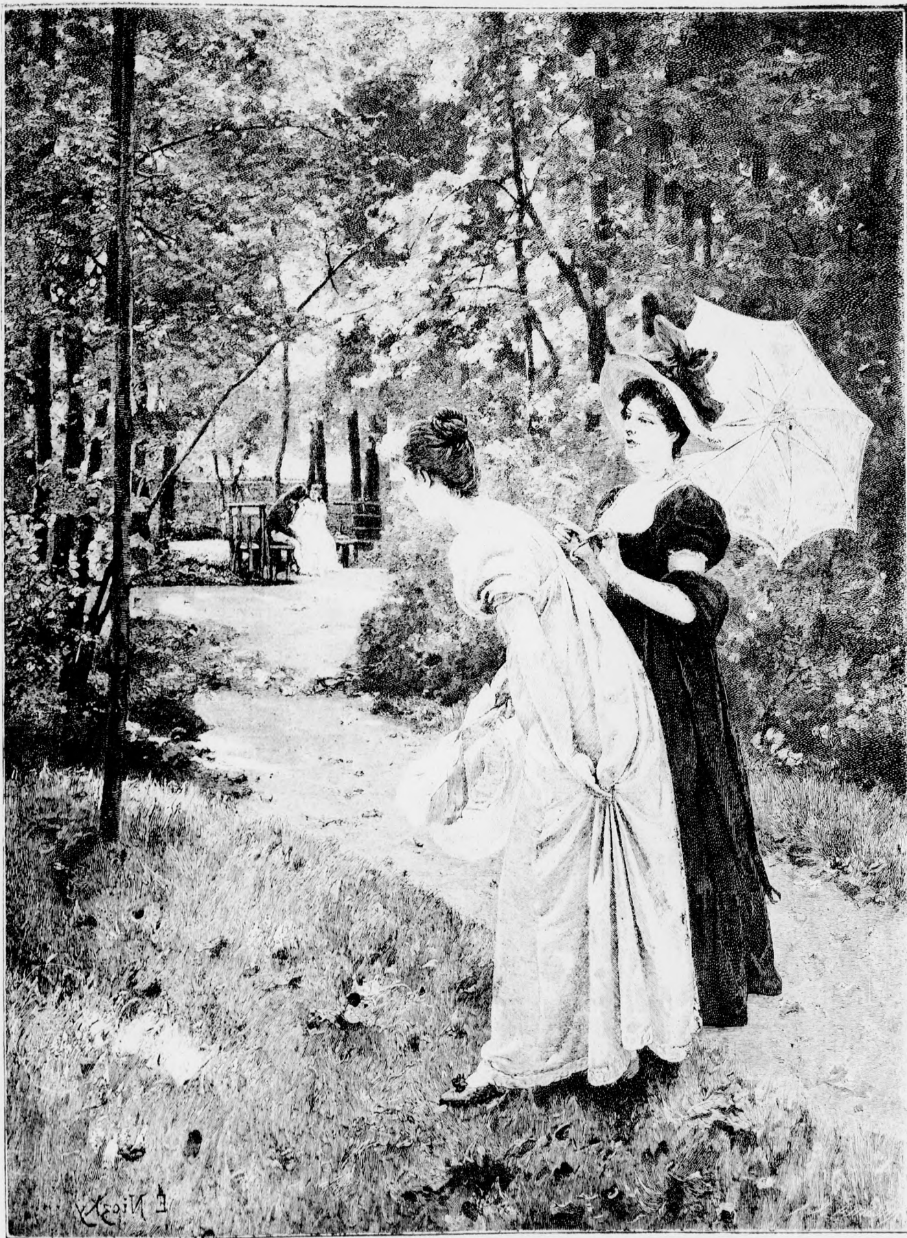
Idyll az erdőben.