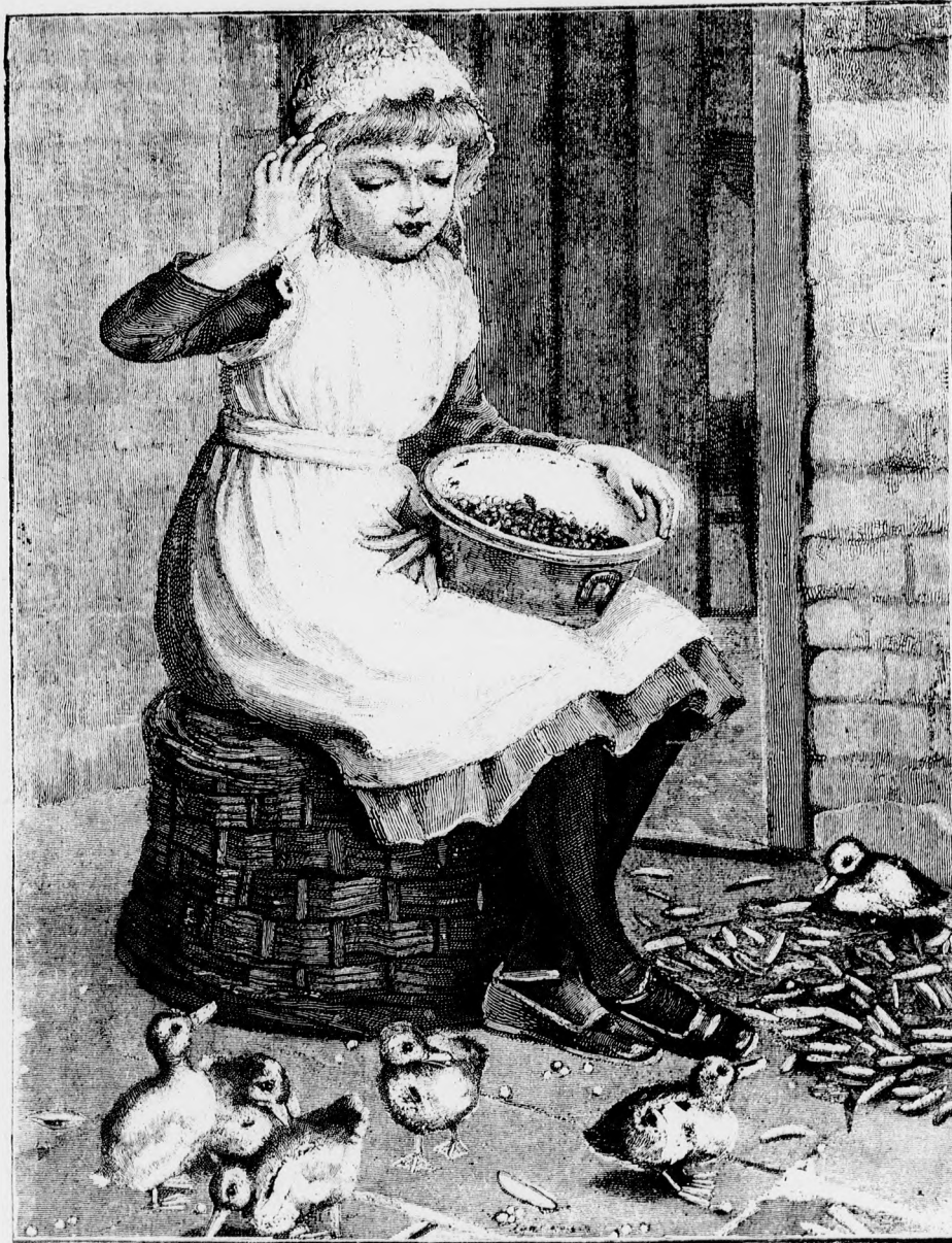
A kis gazdasszony.

— Ezt a szellemes tanulmányt a francia nőről ön tehát csakis azért mondta el, hogy a magam számára is levonjam a tanulságot belőle?