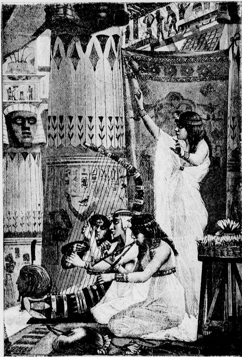
A hárem zenekara.

Férjem imádata lassan józan vonzalommal változott, az én képzelt szerelmem pedig megszokott barátsággá. Gondtalan életem volt és sok, sok szabad időm az ábrándozásra, a fantom-kergetésre. Intézetbeli ábrándjaim föléledtek lelkemben; Heimbürg és Marlitt regényei fogékony talajra találtak bennem s egészen észrevét-