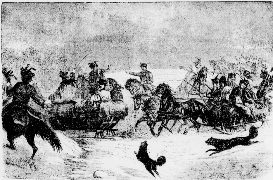
Lakodalmi menet szánkán.

Rövidesen megösmékedett vele, de akkor aztán