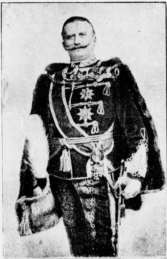
FEJÉRVÁRY GÉZA BÁRÓ.