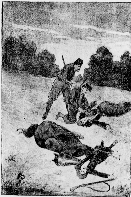
A lövés eldőrdült.

Azután nagy léptekkel sietett el a viskók tövében s a fahid irányában vette útját. Itt a partra érven, kémkedve nézett széjjel, azután oly hangot adott, mely csalódásig utánozta az erdei bagoly kiáltását.