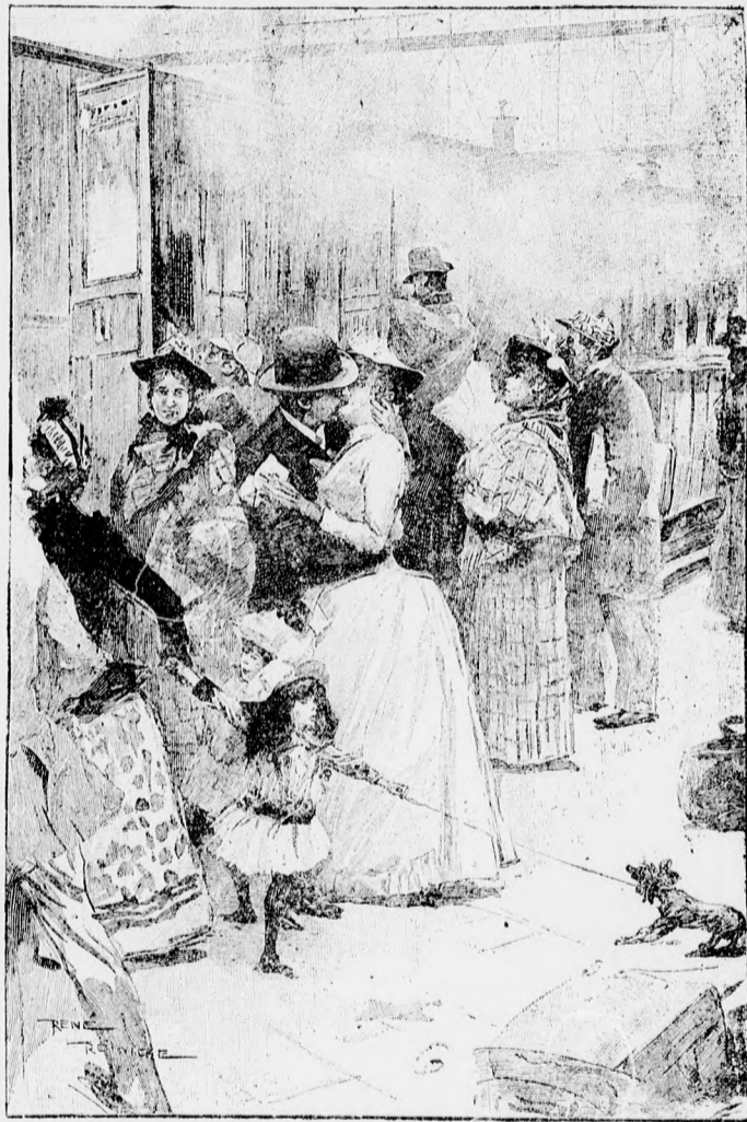
Búcsúzás a pályaudvaron.

Egy budaujlaki kugliversenyen bemutatott egy tanácsnoknak, aki megígérte, hogy protegálni fog, de