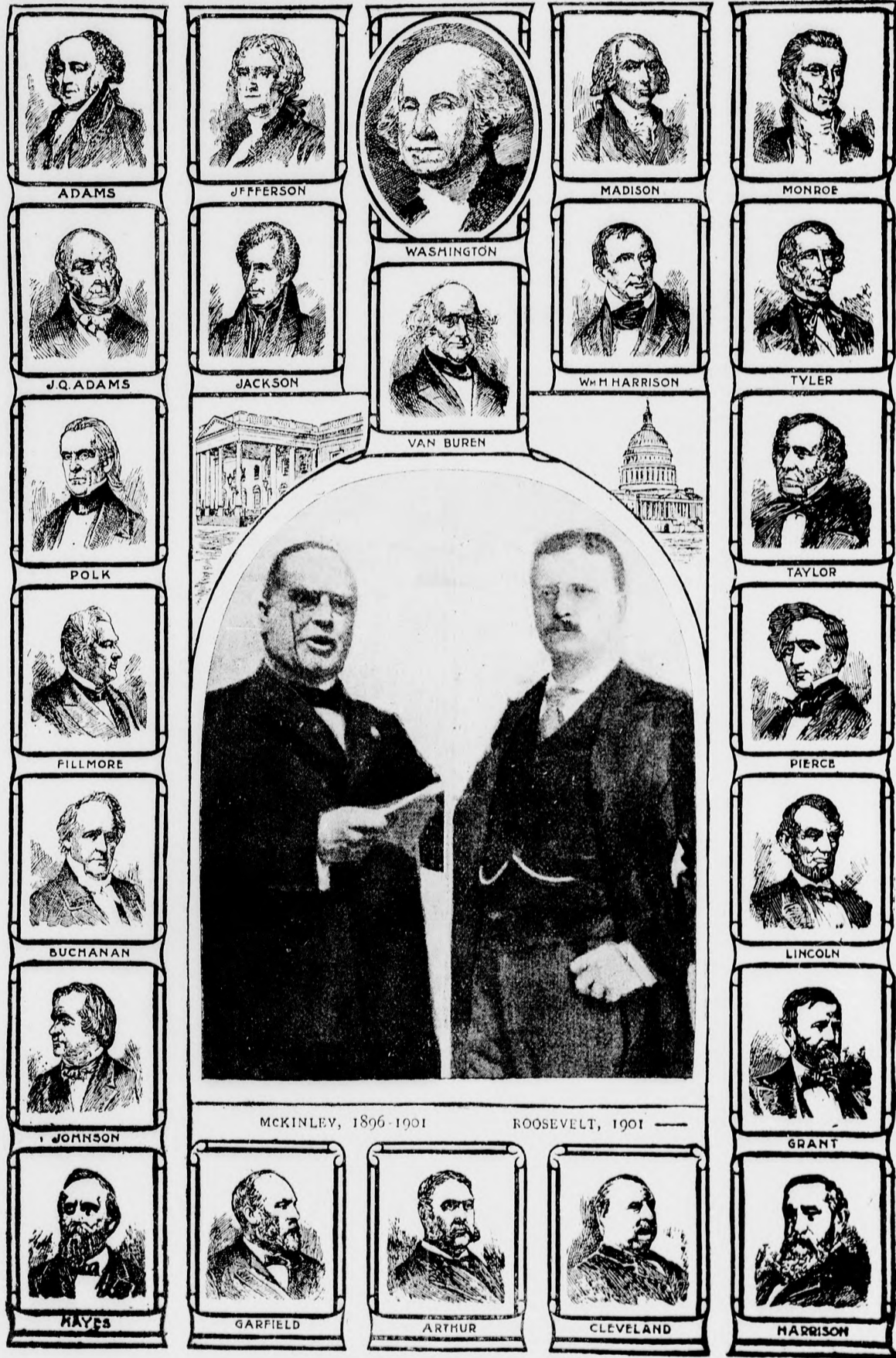
Az Egyesült-Államok köztársasági elnökei.