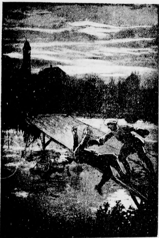
A dervis már ott lebegett a mélység fölött...

— Tánczó és kolduló dervis előtt sok út áll nyitva, uram. Jussuf sok egyebet tud.