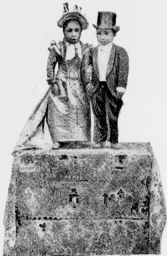
A legkisebb házaspár.

Éjféli tizenkettőt ütött a közeli toronyóra. A fenséges természet siri csendességben . . . mély álomba