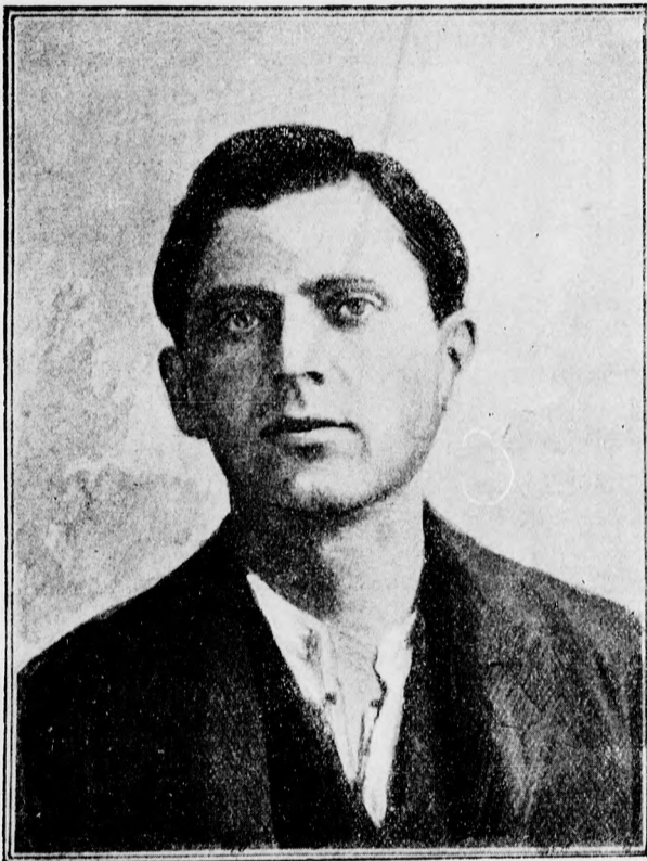
C z o l g o s z .

— Nem hiszem, hogy a mindenható Musztafa azért fogatta volna el Achmed cserkeszfejedelmet, mert Szaid pasa miatt az oroszokhoz fordult, folytatá