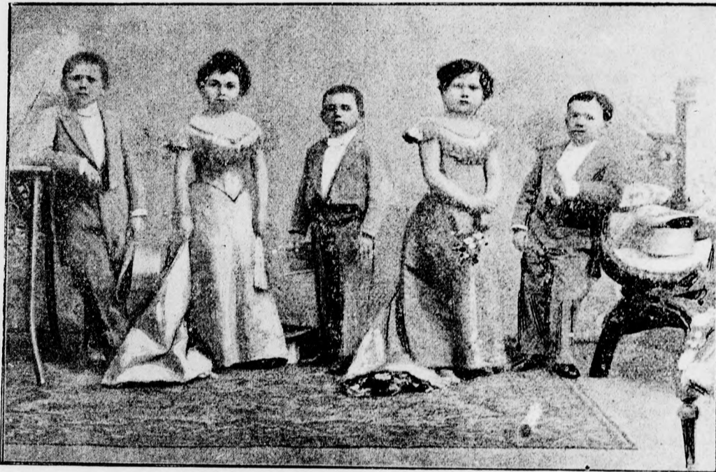
A világ legkisebb törpei.

Elhulltak rendre mind, csak Petőfi menekült s mire a kis csapat éltöket adta Petőfi megmentéseért, ő már messze járt. Még hallatszott a viaskodók ordítózása a távolból, midőn Petőfi Héjjasfalva községhez ért s ekkor hátrapillantván, a távol láthatáron felismerte üldözőit, kik nyilsebességgel közeledtek felé.