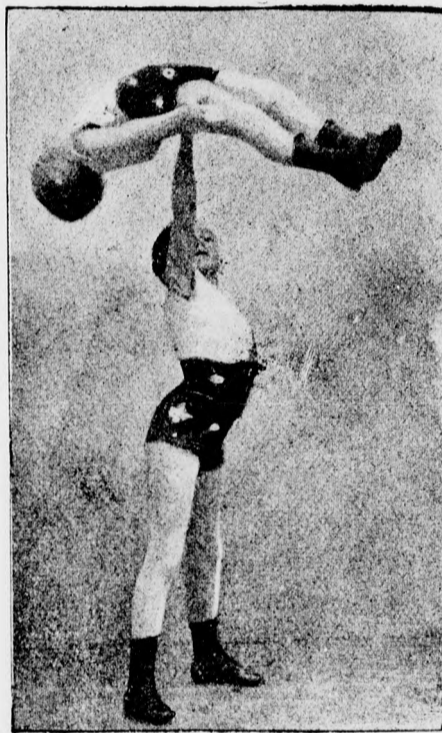
Törpék, mint erőművészek.

Fölkelt a nap s legelső sugarát bocsátá a harcsterre, hogy azt megaranyozza. A kibuvó nap sugarai megtörvén a kék hegyeken, arany küllöket lövelt szét a mezőn. Minden aranyvá változott. A fák lombos árnyai, amik között sugarai átszűrődtek, megaranyozva a harmatos fűvet, fényhidat vetett az alatt kanyargó Nagyküküllőre, mely mint egy zöld bársonyra tett gyémánt-sor csillogott a réteken végig, míg távolabb a rétek világoszöldjét sötétebbzöld, az erdős dombok, melyeknek csúcsaira biborszint festett a felkelő nap. Ugy néz ki mindegyik hegy, mint egy óriás, biborpalástba, kinek homlokát a felkelő nap csókolgatja. Arany szoborrá változtak az elesett hősök.