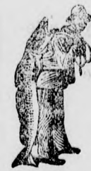
Az Emulsió vásárlásánál a SCOTT-féle módszer védjegyét — a halászt — kérjük

a gyermekek ezen ismert rémét a SCOTT-féle Emulsió minden esetben sikeresen gyógyítja. A SCOTT-féle Emulsió a legjobb szer gyenge, beteges gyermekek gyógyítására, kiknek gyorsan visszaadja rózsás kerek arcukat.