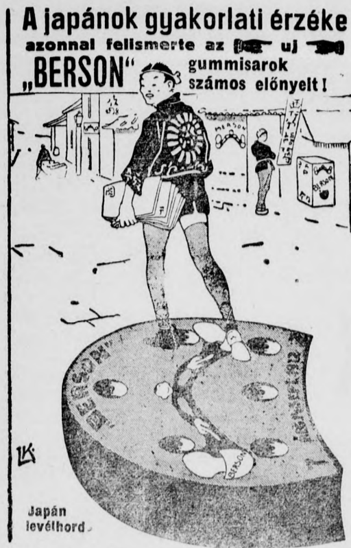
Ferdére taposás, kisiklás, fáradtság, az idegek rázkódtatása kizárva! Bersonművek Budapest, VII.