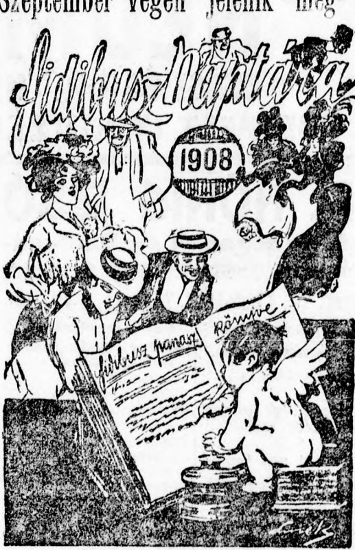
Bolti ára 1 kor. 50 fill.

Mindenki, aki a FIDIBUSZ-ra legalább felére előfizet, ingyen kapja a FIDIBUSZ diszes naptárát.