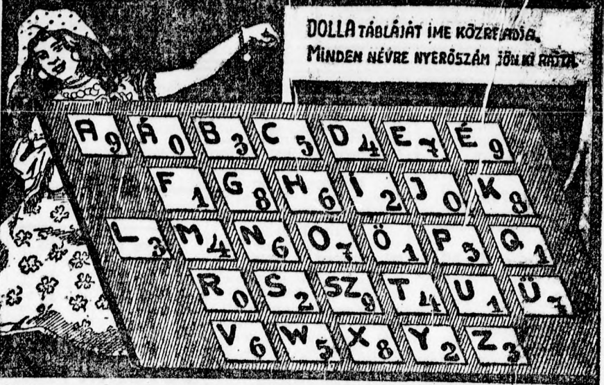
DOLLA TÁBLÁJÁT IME KÖZLÉK ADJA. MINDEN NÉVRE NYERŐSZÁM JÖN KI RÁJÁ.