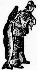
Az Emulsio vásárlásánál a SCOTT-féle mód-szer védeljéért — a halászt — kérjük ügyelmbe vanni.

A SCOTT-féle Emulsio hatása minden alkalommal, ha azt angolokorban szenvedő gyermeküknek adják. A SCOTT-féle Emulsio feltűnő gyorsan gyógyítja és izmosítja a gyermeket, erősíti a csontokat