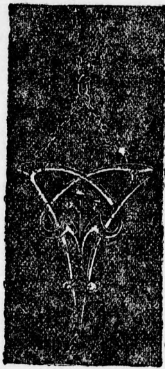
Láncos nyakék briliáns kövekkel ... kor. 140.—

rondes óranagyságban, igen meglepő kellemes és csengős hangú ébresztéssel, legpontosabb járással, nickel tokban ... 12 K Oxidált tokban ... 15 K Valódi ezüstből ... 25 K Négyzet alakú oxidált tokban, világhírű szerkezettel 20 K