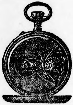
„Terézia” ezüst duplaköpenyű, nagyon erős ezüst tokban, rubin kövel, kitűnő szerkezet, a belső fedelén Madonna kép ... K 24. Egy fedéllel ... K 20.