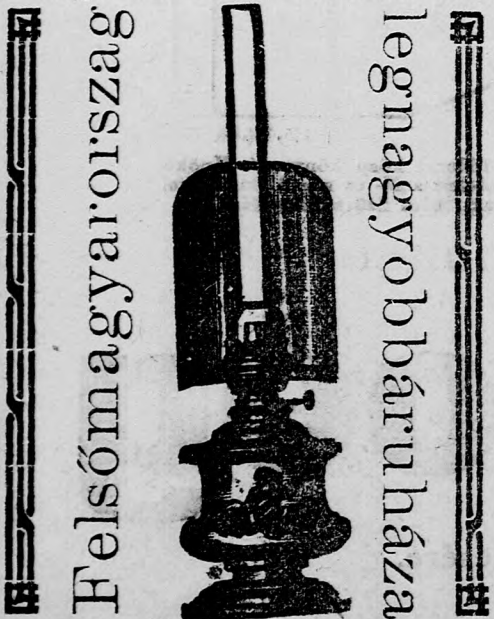
Különosztály: Ditmár-féle lámpák