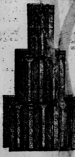
Nagykikindai gyárany. Bohn-féle szab. biztonsági átfedő-cserep 272 mm.

Képes árjegyzék és minták kívánatra ingyen és bérmentve.