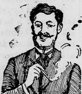
Egger mellpasztilla csakhamar meggyógyított!

zott köhögés! Köhögés, rekedtség, elnyálgasodás ellen gyors és biztos hatásúak