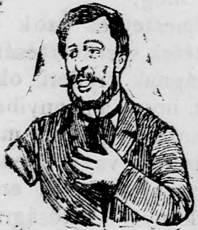
Megfojt ez az átko-