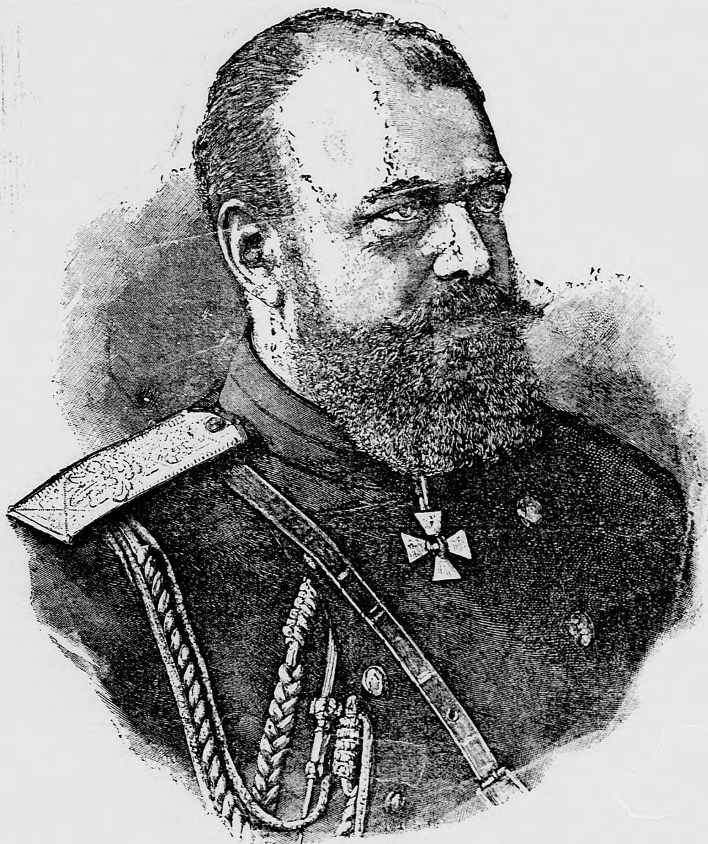
Alexander III. cár ruský.

sem sa majú posielat predplatky, jako i dopisy do novin, ohlášky a náhodné reklamácie. Cena jedného 5 stĺpcového malého riadku je 10 kr.