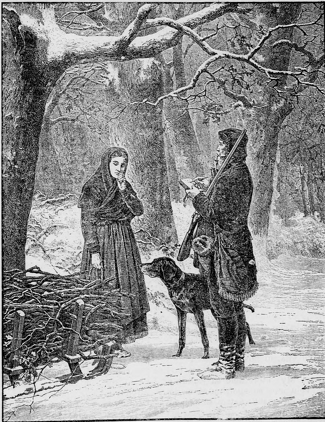
Ako sa voláte.

sem sa majú posielat predplatky, jako i dopisy do novin, ohlášky a náhodné reklamácie. Cena jedného 5 stĺpcového malého riadku je 10 kr.