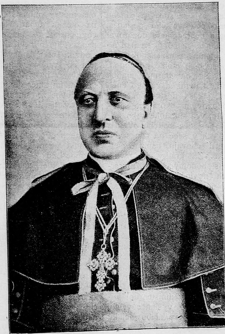
Anton Agliardi pápežský poslanec vo Viedni.

N aším čitateľom už dost známo, lebo v predošlých číslach našich novin sme viac krát pojednávali o ňom. Včul zas sme prinútení o ňom písať. Svätý otec rímský pápež v mnohých, zvláštne v katolíckych alebo aspoň v kresťanských krajinách z ohľadu záujmov cirkve vydržiava veľkých poslancov, ktorí majú za povinnosť predovšetkým osobu svätého Otca, a potom vôbec cirkve a katolíkov zastupovať. Prítomne takýmto veľkým pápežským poslancom vo Viedni u nášho kráľa je cesareiský arcibiskup Anton Agliardi. Keď b. Bánffy stal sa naším ministerským predsedom a pri jednej príležitosti bol vo Viedni, medzi inými navštívil i pápež-