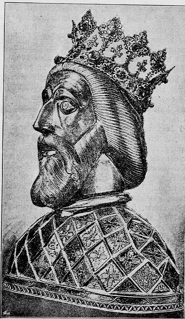
Pozostatky hlavy kráľa Sv. Ladislava.

Donevác sa blížia všôbecné voľby, národ, jako taký činiteľ, ktorý môže mať vliv na spravu krajinských záležitostí, musí znať tú moc, jakú mu ústava vyznačuje, a ktorú ľud pri všôbecných voľbách bezprostredne vykonáva. Každá takáto všôbecná voľba poskytuje ľudu príležitosť, aby svoju vôľu jakožto všôbecnú vôľu vyslovil a teže týmto výrokom v politickom živote platnosti vydobil. A každý zdravý a striedavo smýšľajúci národ, z ktorého ešte nevyhynula počesnosť a náklonnosť k mravom, ktorý tedy nedá sa žiadnym spôsobom, ani peniazmi, ani pálenkou znevážiť, aby strpel, že by sme ho v jeho najväčnejšom politickom účinkovaní obmedzili a mu prekážali, každý takýto národ takým spôsobom vykonáva toto svoje politické právo, jako to jeho najsvätejšie a najdiahšie záujmy požadujú. Od vôle občanov tedy závisí, jako sa krajina má spravovať, od