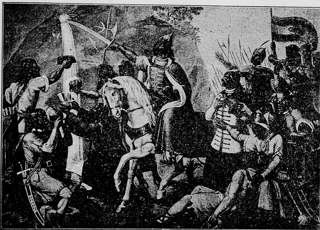
Sv. Ladislav kral zo skaly prameň ot ára.

vždy dobrými katolíkami nazývajú. (Keď by na veky onemeli, keď ich jazyk tie slová dobrý katolík vyslovuje.) To sú tí katolíci tak svet-skí jako i cirkevní. ktorí zo zájemu, za masný