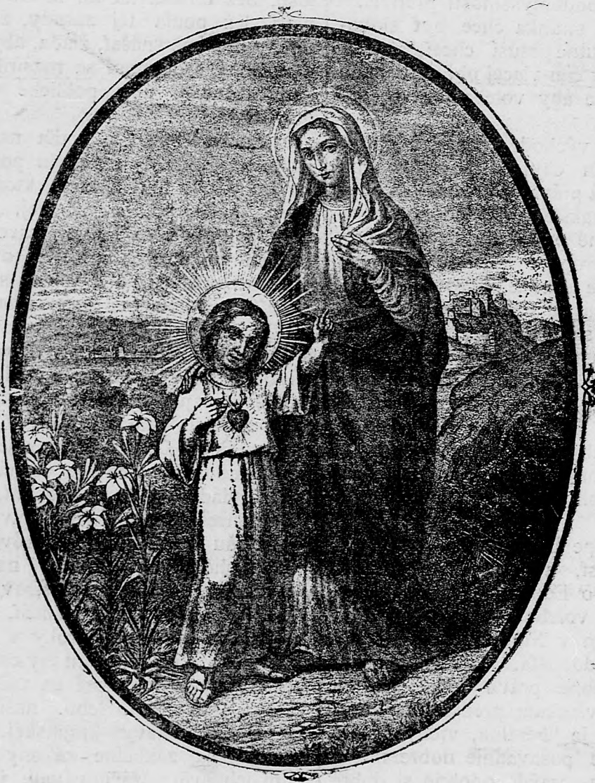
Ježiš, Mária! Pomáhajte!

Vláda Bánffyho nezabáva sa v lete darobne. Napráva a do života uvádza. Do života uvádza cirkevnú politiku a pritom napráva volebné menoslovy. Po celej krajine sú všeobecne žaloby, že pri popise voličov falošne zachádzaly medzitká, ktoré menoslov platný na budúci rok naprávaly. Premnohí, zvláštne ale voličia z ľudovej strany z menoslovu boli vynechaní, naproti tomu liberálni voličia všemožne boli vzatí do menoslovu. V iných okolnosťach takéto chýry pokladali by sme za nemožné, ale včul Boňhád, Caktornia, Nitra dostatočne dokazujú, tieto chýry