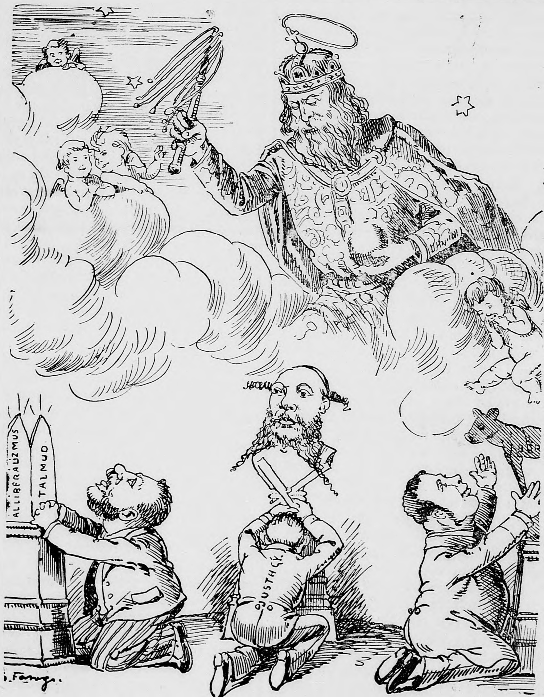
Modly rúcajúci Sv. Štefan a veľajší pohani.

sem sa majú posielat predplatky, jako i do- pisy do novin, ohlášky a náhodné reklamácie. Cena jedného 5 stĺpcového malého riadku je 10 kr.