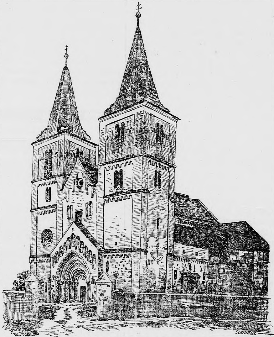
Prastarý chrám jaákského opátstva.

Už sme, t. j. by sme mali byť v riadnej kolaji toho nového civilného života. A predsa bár aj dnes zajtra tri týždne budú, čo tie plody svobodných myslíkov a zednárov do života vstúpily; ešte v žd y to nechce ľud za skutočnú vec uznať, mráz ho prechádza, pokerúc si len myslí na to, že bude museť mať obchod s tými pánm i, ktorých nezbehlosť a neuznanlivosť vo vedení tých nových kníh je hotovým trestom nielen pre vinných ale aj pre nevinných, ktorým sa ešte len pred mesiacom ani nesnívalo o tých beznábo-