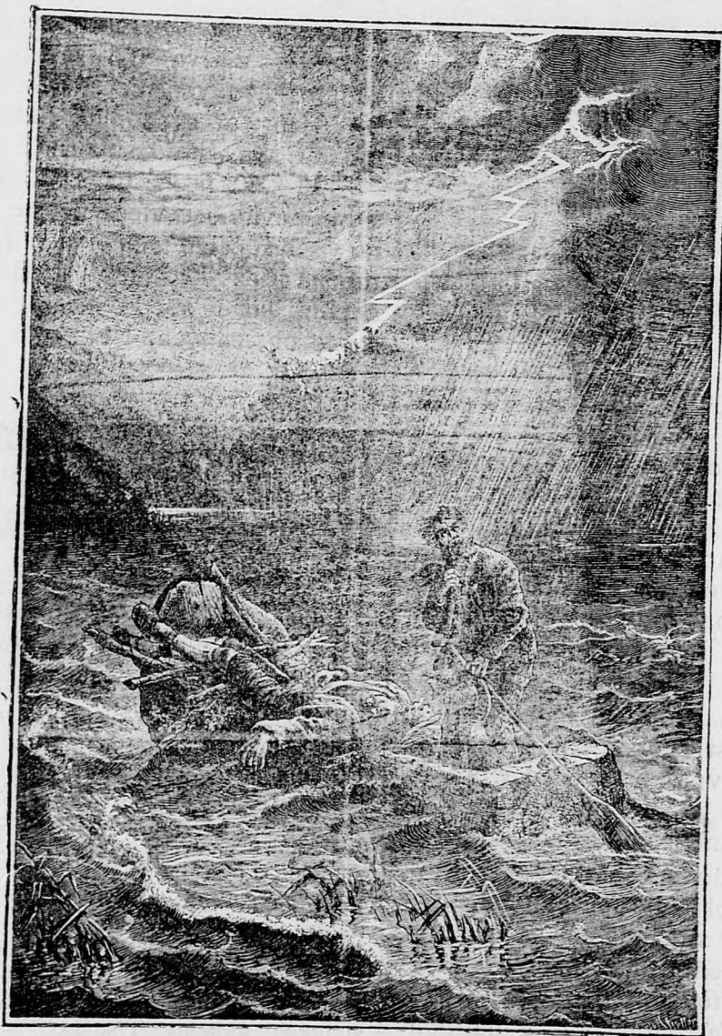
Poslednia cesta pytlíaka, (zverokmíňa).

Vodcovia prírodní ľudu sú jeho duchovní. Kňaz teda má prácu nielen dľa svojho povolania, lež i jako človek, a jako vodca ľudu musí byť odhodlaný i s obetivosťou ľud zastávať a viesť. Koľkým sa ale o tejto povinnosti ich