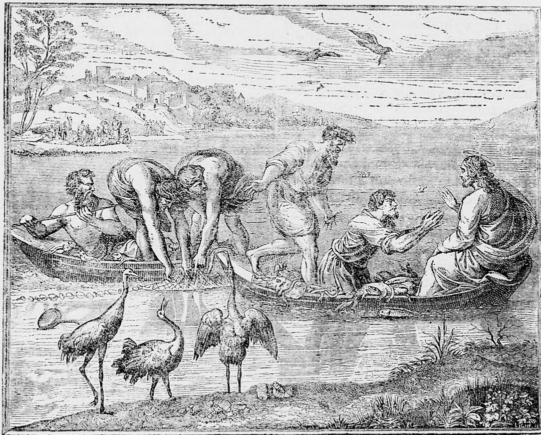
Zázračné lovenie rýb.

sme pokročili vo vedách, vzdelanosti a vo všetkých záležitostiach tak verejného jako i privátneho života.