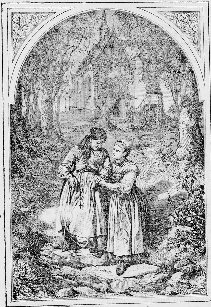
Podpora starej matky.

Konečne sa našli i tak udatní mužovia, ktorí ačkoľvek nepatria ku ľudovej strane, predsa cítili v sebe toľko statočnosti, že bez slova nepominuli tie podlosti, čo si liberálna vládna strana naprotivá ľudovej strane posávať dovolila. Posávať vládna liberálna strana vydala svojim privržencom ten rozkaz, že naproti ľudovej strane každá nezákonnosť, každá krivda, každá podlosť je dovolená, že čokoľvek liberáli proti ľudovej strane spáchajú, preto že žiadneho trestu obávať sa nemajú, že sa im preto ani vlas na hlave nepohne. Ludová stranaliberálom je preto tak nenávidená, že chce ľud, jeho vieru a náboženstvo zastávať, a že sa nesháňa len