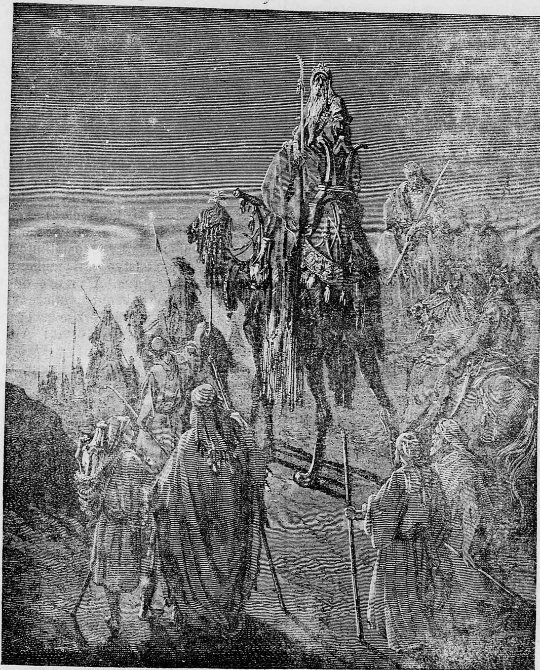
Traja králi od východu.

Redakcia a vydavateľstvo / Budapešť: VIII. ker., Práter-úlica 44. sem sa majú posielat predplatky, jako i do- pisy do novin, ohlášky a náhodné reklamácie. Cena jedného 5 stĺpcového malého riadku je 10 kr Rukopisy sa naspák nedávajú.