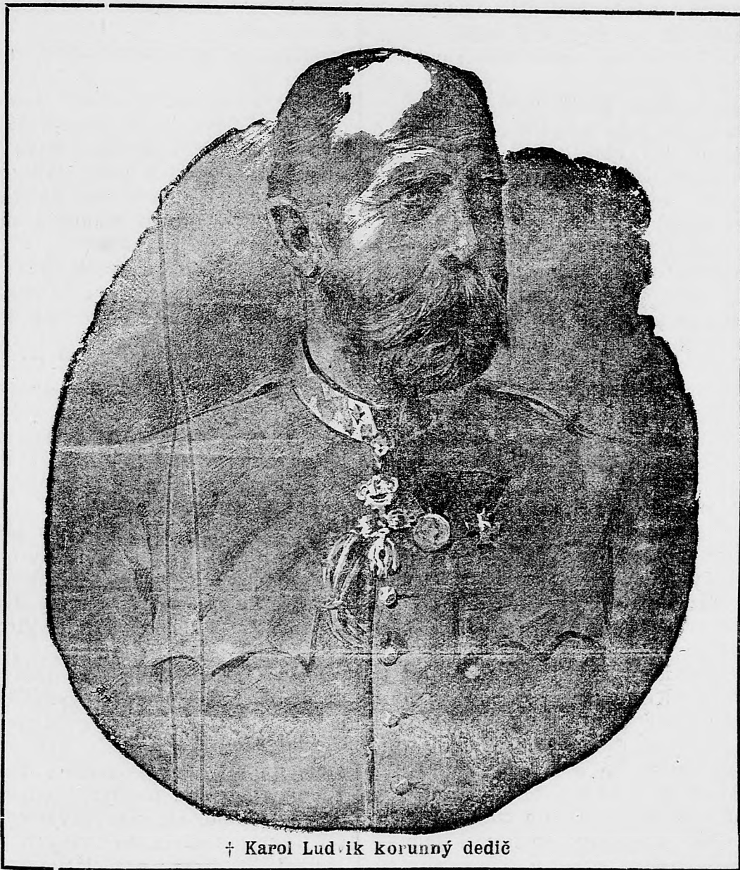
† Karol Ludvík korunný dedič

sem sa majú posielat predplatky, jako i dopisy do novin, ohlášky a náhodné reklamácie. Cena jedného 5 stĺpcového malého riadku je 10 kr. Rukopisy sa naspá k nedávajú.