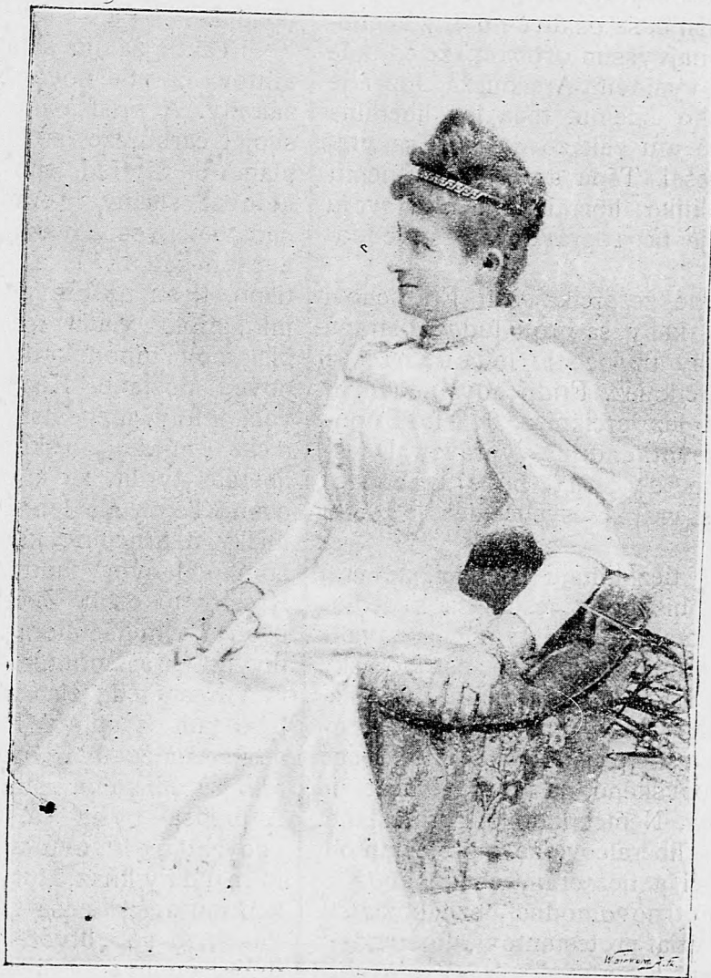
Kráľ. arcikňažna Mária Dorota.

Nedávno bezočivú luhaninu pustili do sveta liberálci, o arcikniežatu Fridrichovi, ktorému také slová dali do úst, ktoré on povedať ani príležitosť nemal. „Opravdiví“ kresťania pýšili sa, že vraj ľa ľa! pozrite! arciknieža Fridrich odsudzuje ľudovú stranu a že keďby politizoval, vtedy vraj držal by so stranou vládnu, lebo vraj v tejto vyjadrená je politika kráľova. „Opravdivý“ liberál písal, že: Túto odpoveď nech dobre zapamätajú si naši bratia Slováci! — Sám najvyšší dvorný úradník za luhaninu vyhlásil túto odpoveď, ktorú si vraj dobre máme zapamätať! Lež liberálne noviny nemajú toho citu pravdomluvnosti, aby tú odpoveď, s ktorou sa námramne pýšili, teraz za luhaninu vyhlásili. Naraz o arcikniežatu Jozefovi prišli nov. „Alk.“ také chýr, s ktorým sa liberálci „oprav.“ zaiste nebudú chváliť. Arciknieža Jozef v Ungvári prezeral vojsko a pri tej príležitosti na poklonu prišli mu kanonici, na čo arciknieža Jozef takto odpovedal: „Nielen môj pán a kráľ, lež i celá krajina vie, že katolíctvo vždy bolo podporou vlasti a trónu. Teraz usilujú sa síce niektoré kruhy, aby to plášťom zabudnutia prikryli. Avšak od nás závisí, toto pre-