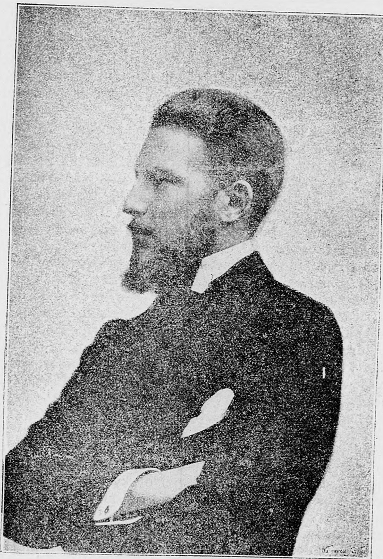
Filip Robert Ludvík orleánske kr. knieža.

Páni mameluci naši teda odpočívajú, veď majú prázdniny, alebo vakácie. Lenže čo z tých prázdnin, keď mameluci, ako leniví a darom-