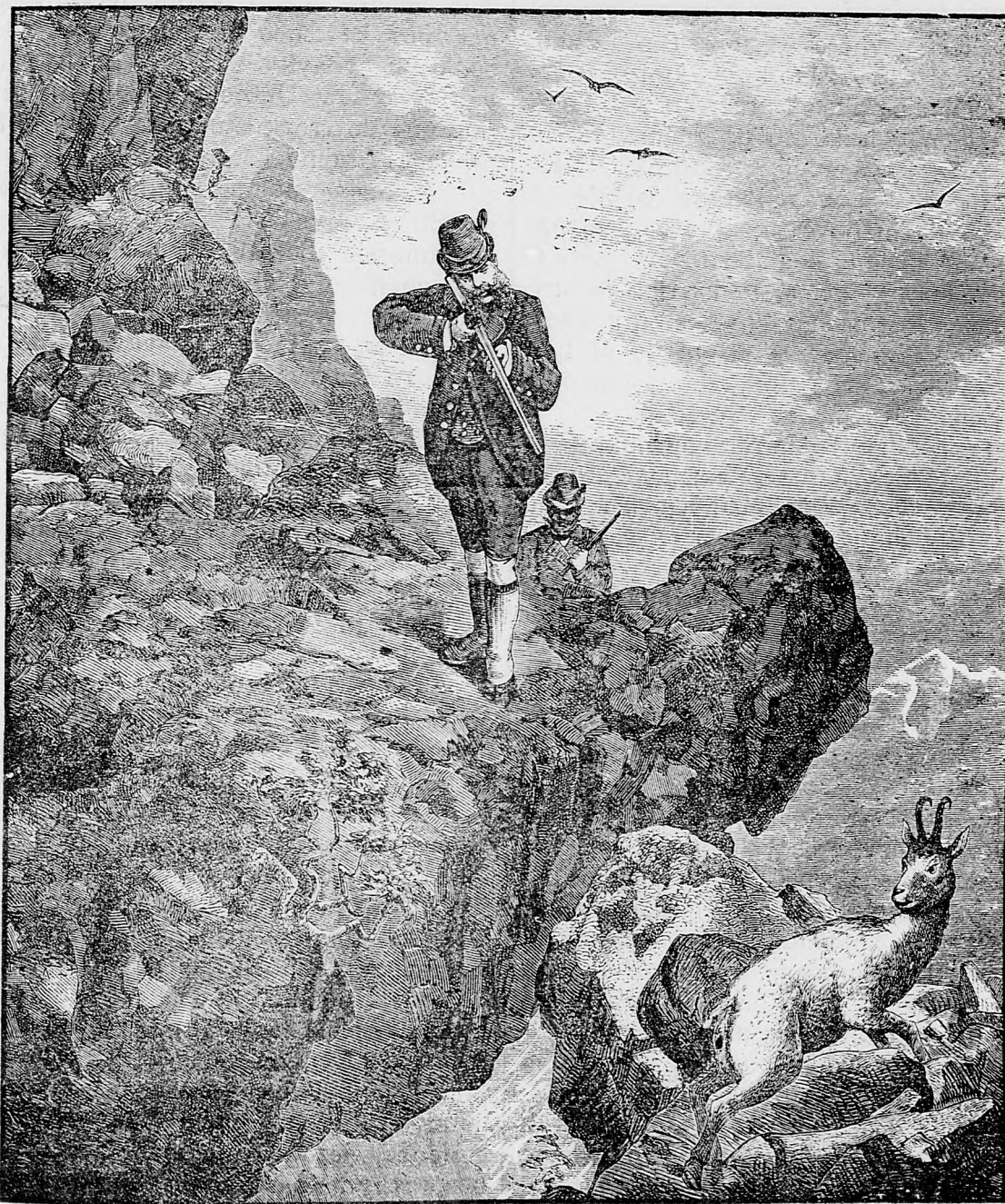
Krčí na polovačke na divé kozy.

sem sa majú posielat predplatky, jako i do- pisy do novin, ohlášky a náhodné reklamácie. Cena jedného 5 stĺpcového malého riadku je 10 kr. Rukopisy sa naspák nedávajú.