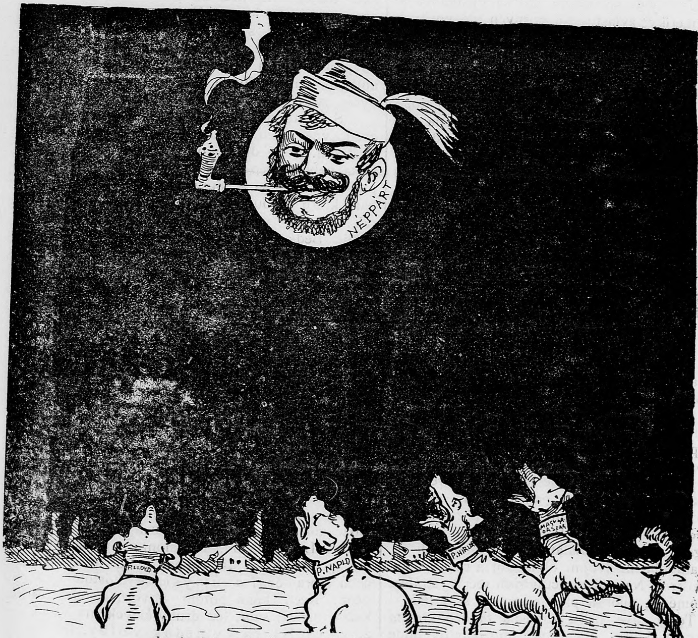
Obraz ľudového položenia.

Len brechajte moji psičky — nevšímaj si vás budem vždycky. Len to jedno je dobre, že váš hlas — po nebesá nedôjde ani len raz.