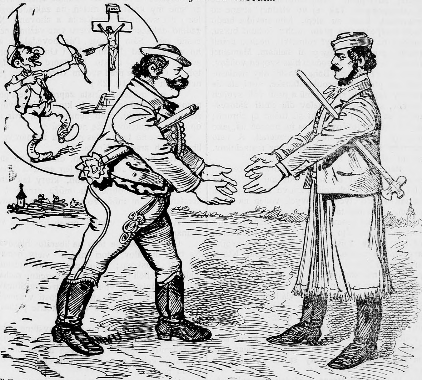
Smerujúci sa susedia.

Jožko L'udák: Zdrav buď, ja veru vo vážnosti mám kríž, a to sa mi nepáči, keď na môjho Spasiteľa Ježiša jordaní strieľajú. Tu veru už musíme dačo započat.